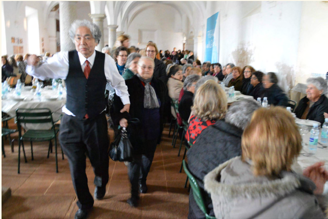
折元立身《500人のポルトガルのおばあさんのランチ(記録映像)：サンベント・デ・カストリス修道院(ポルトガル、エヴォラ)》 2014年 シングルチャンネル・ビデオ ©ART MAMA FOUNDATION 個人蔵