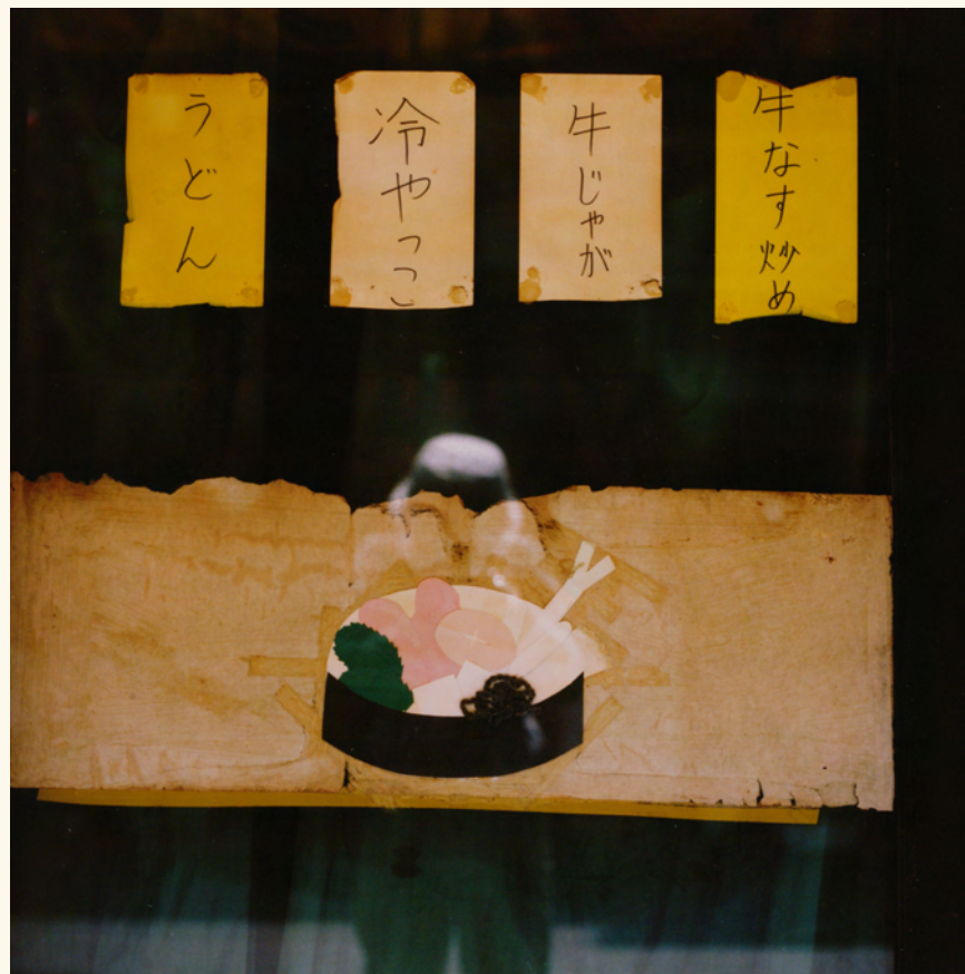
奈良原一高《浅草》〈ポケット東京〉より 1993-1996年 発色現像方式印画