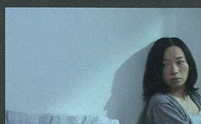
2011年 ジャパン部門優秀賞 中国野馬 (河村勇樹監督)