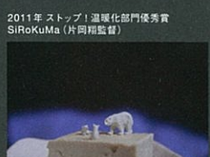
2011年 ストップ!温暖化部門優秀賞 SiRoKuMa (片岡剛監督)