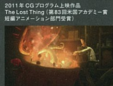
2011年 CGプログラム上映作品 The Lost Thing (第83回米国アカデミー賞短編アニメーション部門受賞)