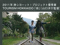
2011年 旅ショート!プロジェクト優秀賞 TOURISM HOKKAIDO「雪」(山口洋介監督)

「旅」をテーマとしたショートフィルムを通じて、日本の魅力、旅の素晴らしさを伝えませんか? プロジェクトパートナー:観光庁(国土交通省) http://www.shortshorts.org/travel/ 募集締切: 2012年1月16日