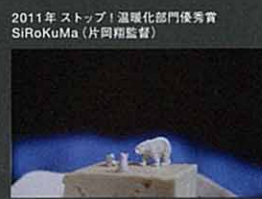
2011年 ストップ! 温暖化部門優秀賞 SiRoKuMa (片岡雅監督)