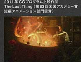
2011年 CGプログラム上映作品 The Lost Thing (第83回米国アカデミー賞短編アニメーション部門受賞)