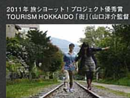
2011年 旅ショート!プロジェクト優秀賞 TOURISM HOKKAIDO「街」(山口洋介監督)