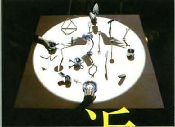
近森基+久納鏡子 『Tool's Life 道具の隠れた正体』 2002年 東京都写真美術館