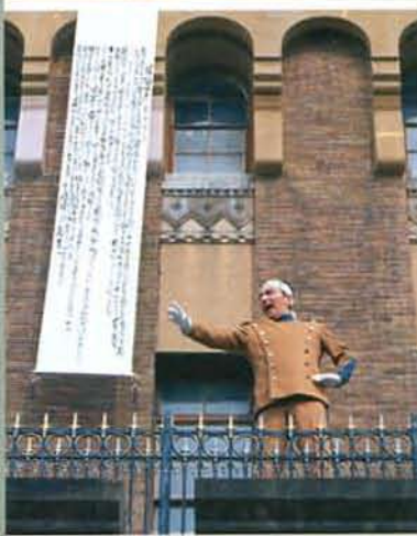
森村泰昌「女にものかへのレクイエム (MISHIMA)」 1970.11.25-2006.4.6 2006年 東京都写真美術館

東京都写真美術館 Tokyo Metropolitan Museum of Photography