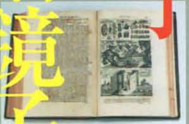
アタナシウス・キルヒナー 『光と影の大きいなる術』1971年より 『カメラ・オブスクラ化図』ほか

■関連事業： 会期中にトークやフロアレクチャーを行います。日程・ 内容等の詳細は12月以降ホームページにてご確認ください。