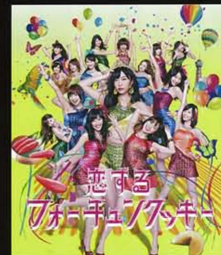
広告作品部門 [美しい日本賞] / レスリー・キー