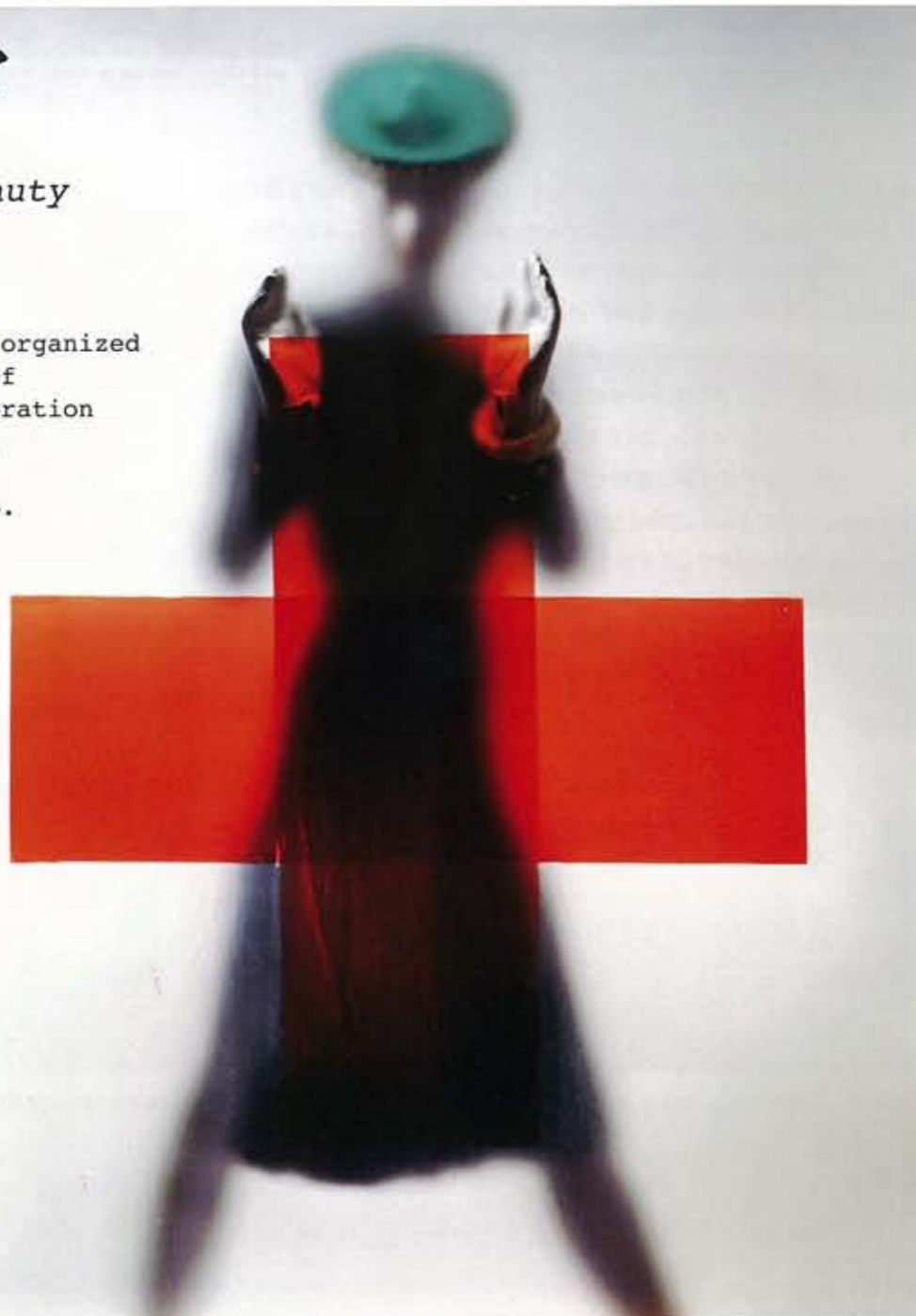
「赤十字を担おう」『ヴォーグ』アメリカ版、1945年3月15日号表紙 “Do your part for the Red Cross”, Vogue US cover, 15 March 1945 ©The Estate of Erwin Blumenfeld 東京都写真美術館蔵

“Erwin Blumenfeld: a hidden ritual of beauty” is organized by Tokyo Metropolitan Museum of Photography in special collaboration with Nadia Blumenfeld-Charbit, The Blumenfeld Family and Jean-Louis & Mado Mellerio.