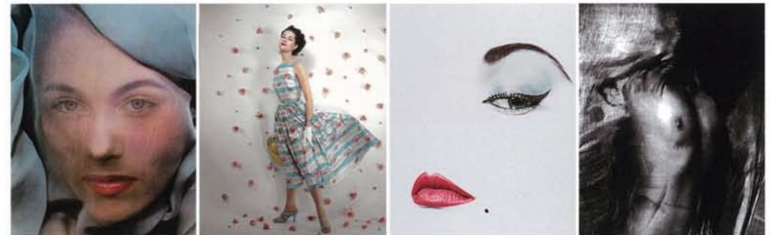
写真左より、『ヴォーグ』US、1949年11月号/『ヴォーグ』US、1953年5月号/『ヴォーグ』US、1950年1月号/《無題》1937年 ©The Estate of Erwin Blumenfeld

ジ・プリントや作家自身が選出した名作100点、カラー復元された美しいファッション写真などが集められました。本展覧会はパリのジュ・ドゥ・ポーム美術館に先んじて、それらの資料から独自の視点で構成した約200点の作品群をご紹介する貴重な機会です。シュルレアリスムからヌード、ファッションまで網羅し、多くの写真家に影響を与えたブルーメンフェルドの表現ですが、その影には二大戦に翻弄され、時代に応じて活動の場を選択せざるを得なかった作家の苦悩が存在します。作家の活動を通し、時代背景、思想などに視点を向けると、美しい表現の根底にある精神が見えてくるのです。華やかな作品に隠された美の秘密をぜひ探してみてください。