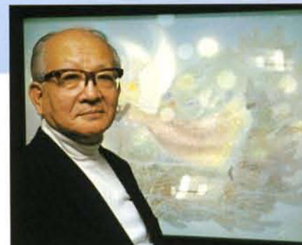
影絵展会場の藤城清治