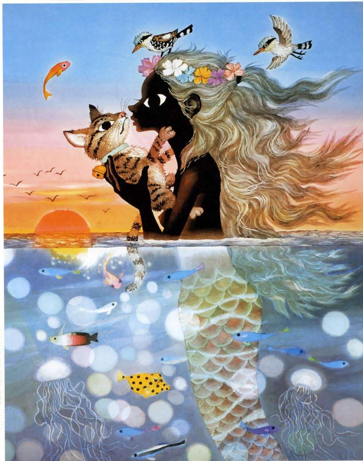
夕陽の中の愛の奇跡 2004年作