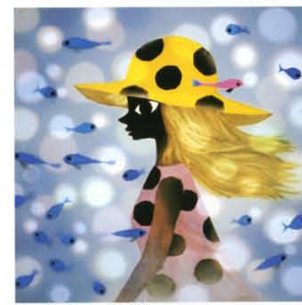
夏 魚しました 1990年作