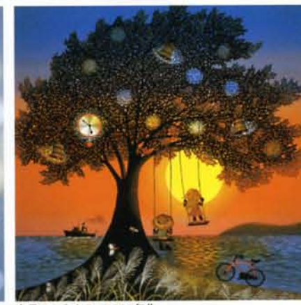
夕日のぶらんこ 2002年作

東京都写真美術館 地下1階・映像展示室 (恵比寿ガーデンプレイス内) 〒153-0062 東京都目黒区三田1-13-3 TEL: 03-3280-0099 JR恵比寿駅東口より徒歩約7分 http://www.syabi.com/