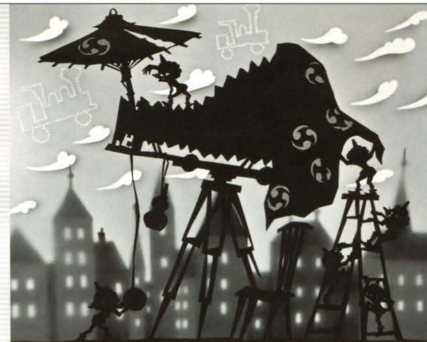
小男のしゃしんや 1954年作

2004年4月に傘寿(80歳)を迎えたのを記念して開催する本展は、まさに藤城清治の集大成となる本格的な展覧会となります。