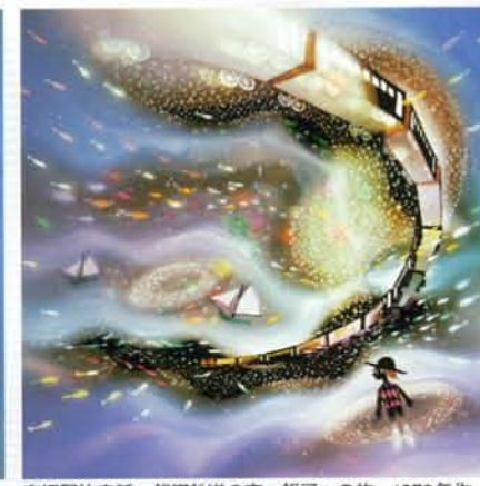
宮沢賢治童話・銀河鉄道の夜 銀河への旅 1978年作