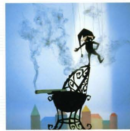
たばことこごと 1960年作