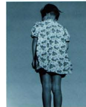
題不詳(後ろ向きの少女)/1949年