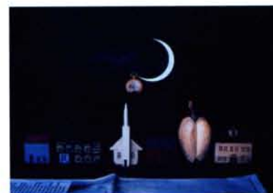
作られた夜/シリーズ「幻視遊園」より/1992年 植田正治写真美術館蔵