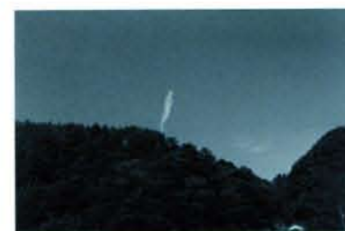
シリーズ「風景の光景」より/1970-80年