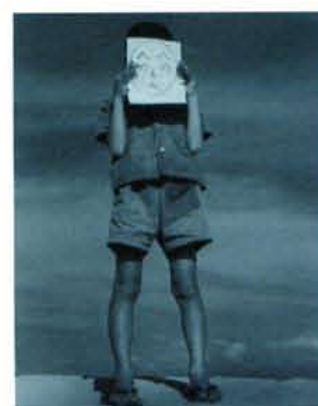
へのへのもへの/1949年