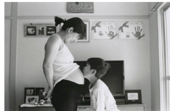
銅賞 飯島進介「ぼくのおとうと」4枚組