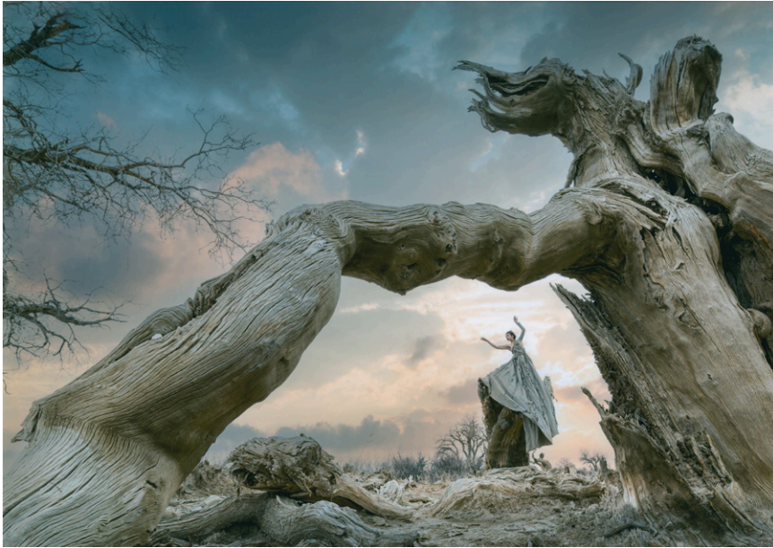
東京都知事賞 鄭 斯佳「シルクロード巡礼」4枚組