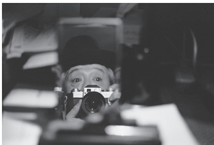
ライカを構える 木村伊兵衛自写像 1965年

没後50年に合わせ、本展では最近発見されたニコンサロンでの木村伊兵衛生前最後の個展「中国の旅」(1972-1973)の展示プリントを特別公開します。