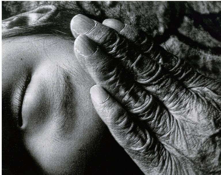
金賞 大澤秋良「桃太郎と年齢」単写真