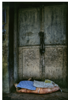
銅賞 西川武則「路地」3枚組