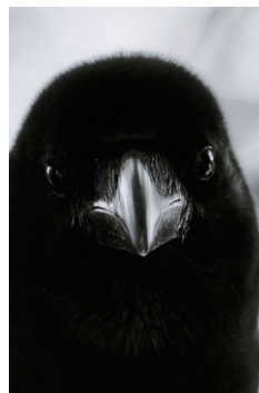
銅賞 小川雅之「微笑んだカラス」単写真