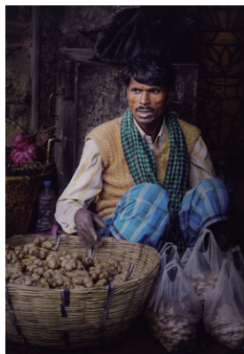
銀賞 増田俊次「たそがれる男たち」3枚組