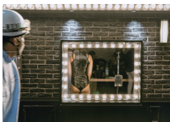
18歳以下部門最優秀賞 藤本優大 「渋谷スナップ／45分」3枚組