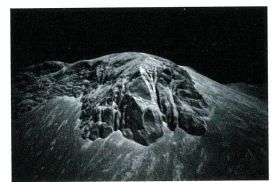
銅賞 安養寺亨「サンドアート」3枚組