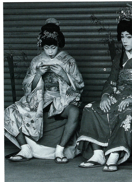
金賞 西原洋一郎「休憩時間」単写真