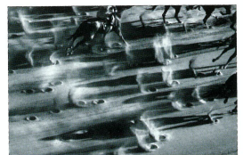
銀賞 新井 尚「疾駆」単写真