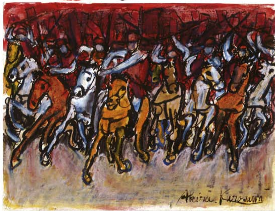
彫武者「設楽原・決戦場」©Kurosawa Production Inc. Licensed exclusively by HoriPro Inc.