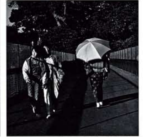
《東京景》より, 1970年代, セラチンシルバープリント*