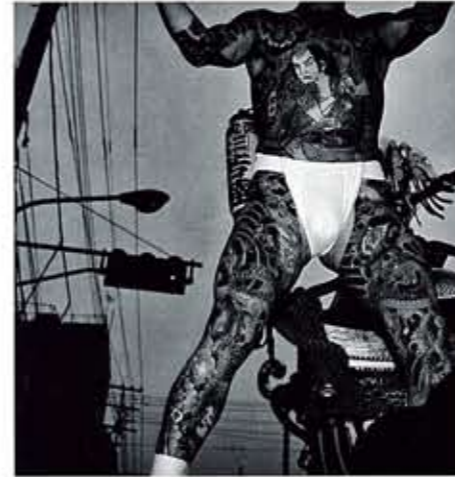
《物草拾遺》より, 1981年, セラチンシルバープリント*