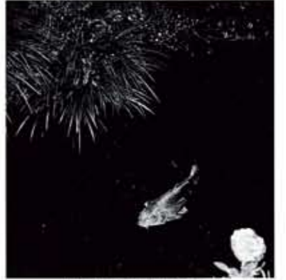
《物草拾遺》より, 1981年, セラチンシルバープリント*