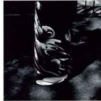
《LIVE》より(埼玉-秩父), 1979年, セラチンシルバープリント, 作家蔵