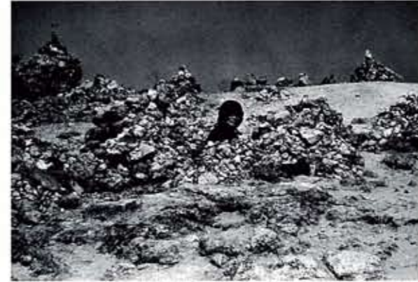
《登山へ》より(青森-恐山), 1972年, セラチンシルバープリント, 個人蔵