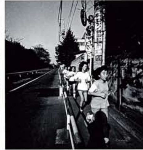
《東京景》より, 1970年代, セラチンシルバープリント*