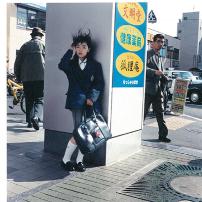
蔵真墨(神奈川県横浜市) 2004年 作家蔵