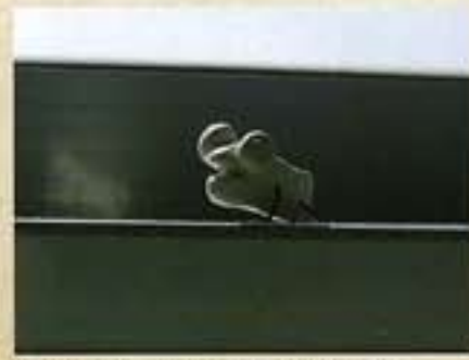
全国造形教育連盟委員長賞(中学生の部) / 森 健