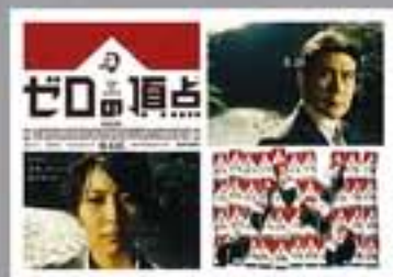
広告作品部門【特別賞】/ 藤本祥也