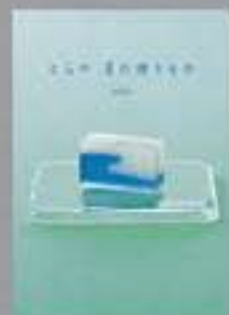
広告作品部門【優秀賞】 / 小山健男