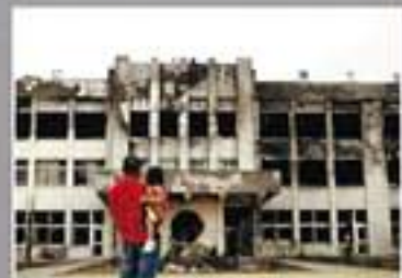
写真作品部門【学生賞】/ 大出文仁