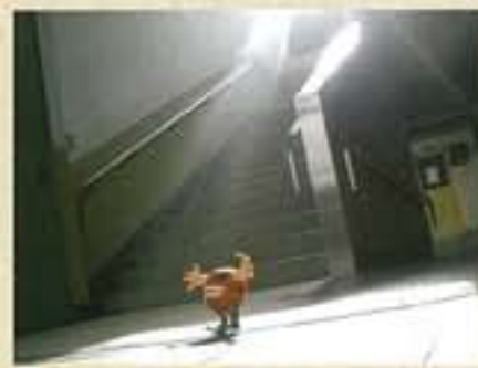
文部科学大臣賞 / 後上 翔一郎