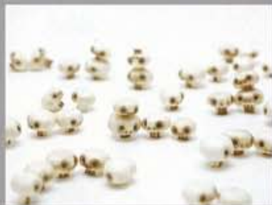
写真作品部門【文部科学大臣賞】/ 高野 浩