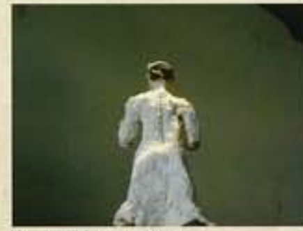
APA賞(小学生の部) / 戸室幸太郎