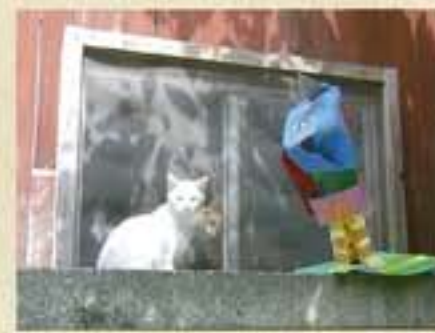
全国造形教育連盟委員長賞(小学生の部) / 石川 謙