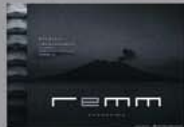
広告作品部門【美しい日本賞】/ 西 有隆