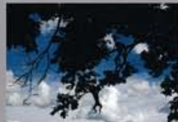
写真作品部門【金大賞賞状】/ 松本政二