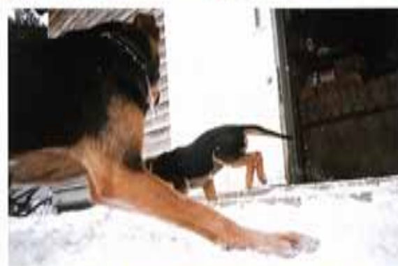
パトリック・ツァイ「God Only Knows」