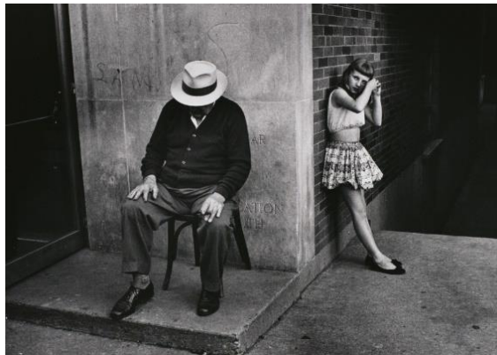
《シカゴ こども》 1958-61年頃 東京都写真美術館蔵