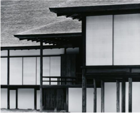
《桂離宮 中書院東庭から楽器の間ごしに新御殿を望む》