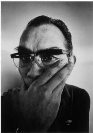
《セルフ・ポートレート》 1975年 高知県立美術館蔵

1921年アメリカ合衆国サンフランシスコに生まれる。3歳のとき両親の郷里である高知県に戻り、1939年高知県立農業高校を卒業。同年に渡米し、終戦後は、シカゴのインスティテュート・オブ・デザイン（通称：ニュー・バウハウス）で、写真技法のみならず、石元作品の基礎を成す造形感覚の訓練を積む。1956年川又滋子（筆名：滋）と結婚。1969年に日本国籍を取得。丹下健三、磯崎新、内藤廣など日本を代表する建築家の作品を多く撮影したことで知られる。1983年に紫綬褒章、1993年に勲四等旭日小綬章を受章、1996年に文化功労者となる。2006年、高知県立美術館に作品や資料の寄贈が決定。3万5千点におよぶプリント作品のほか貴重な資料が収蔵されている。これら石元コレクションを社会の共有財産として管理し、研究・普及するため2013年に「石元泰博フォトセンター」が発足、現在に至っている。