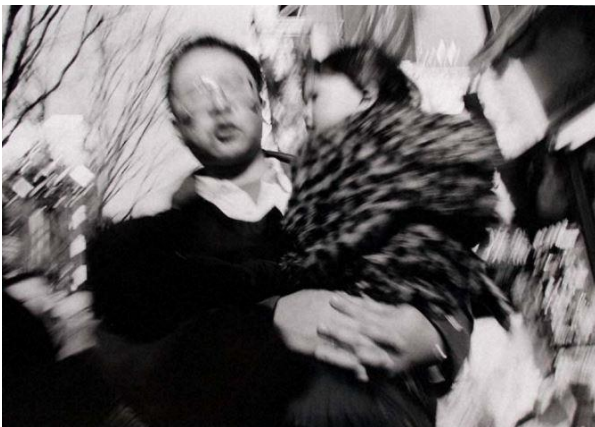
《人の流れ》2001年 高知県立美術館蔵

都市を往還しながら、街とその空間に生きる人々へ向けられた石元の視線は、1980年代にニューヨークのセントラルパークで、濡れた落ち葉へと向けられます。この落ち葉に始まり、空き缶、雪のあしあと、雲、水、人の流れをモチーフとして撮影されたこれらの作品群によって、〈うつろい〉というシリーズが形作られました。そしてこのシリーズは、2004年に写真集『刻moment』（平凡社）へと昇華されました。本展では、写真集の上梓以前に収集された東京都写真美術館の収集作品のほか、高知県立美術館蔵の収集作品を加えてミクロな断片と俯瞰的な視点の両面から、都市の再構築へ挑んだシリーズを展覧します。