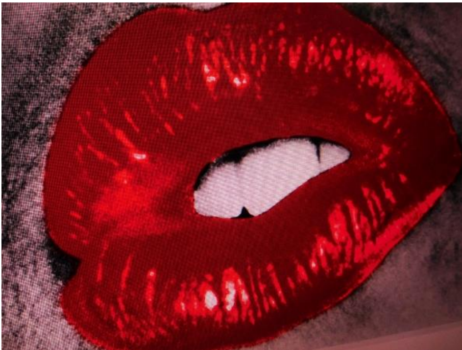
森山大道『東京ブギウギ』より 2018年 ©Daido Moriyama Photo Foundation

本展は諸般の事情により内容を変更する場合がございます。最新情報は当館ホームページをご確認ください。