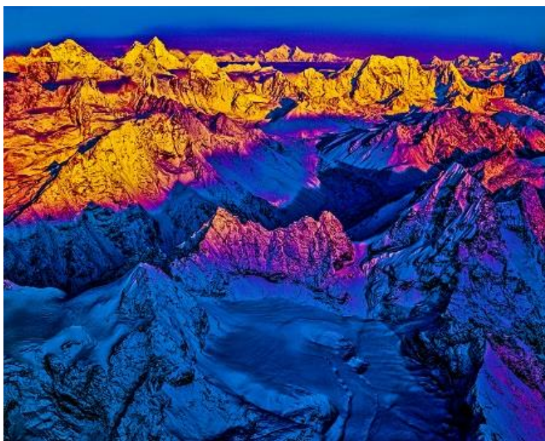
《ヒマラヤ連山、ネパール・中国》

※新型コロナウイルスの感染拡大防止のため、本展覧会は3月31日(火)まで開催休止と致します。なお、4月1日以降の情報につきましては、改めて当館ホームページでお知らせいたします。