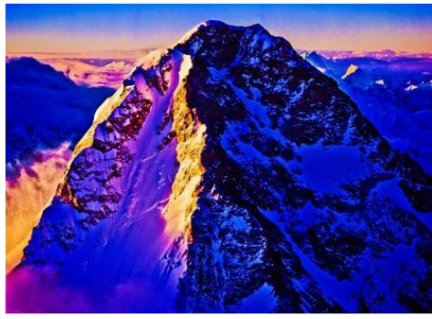
1 《雌阿寒岳夕照》、2 《K2 8611 メートル北陵、パキスタン・中国》、3 《浅間山》