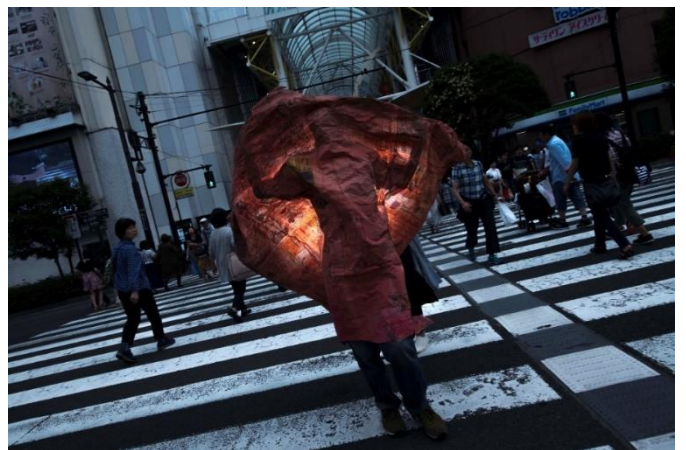
左右ともに〈ヒューマン・スプリング〉2018年 作家蔵 ©Lieko Shiga