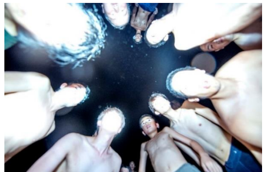
〈ヒューマン・スプリング〉2018年 作家蔵