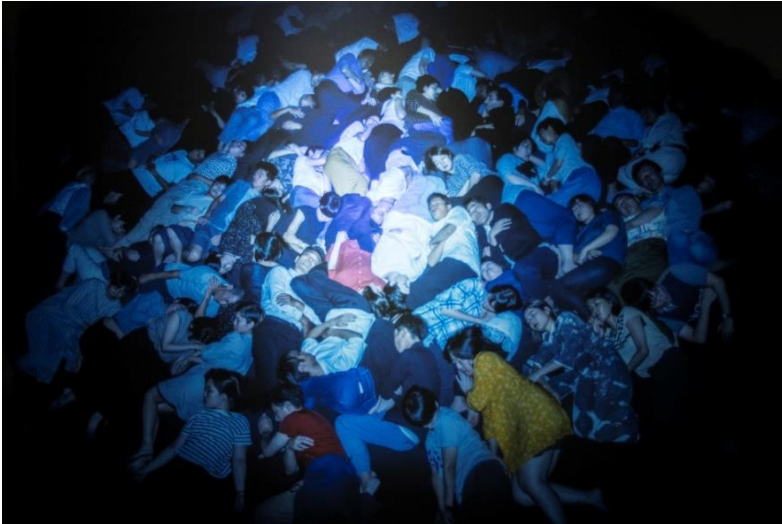
〈ヒューマン・スプリング〉2018年 作家蔵 ©Lieko Shiga