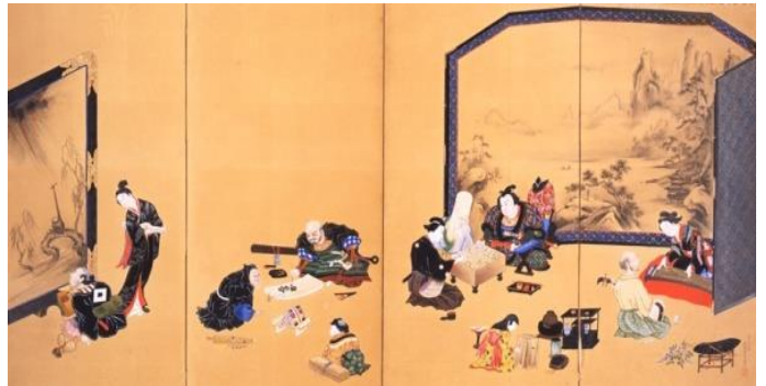
《琴棋画図屏風》紙本着彩・四曲半双 大正元(1912)年 神奈川県立近代美術館蔵 * 本リリースでは展示との統一表記として下岡蓮杖の年齢を教え歳で表記しております。

92歳*の筆であると明記されている本作の精密な筆致に注目。最晩年においてなお、研ぎ澄まされた絵師・蓮杖の確かな画力を堪能できます。