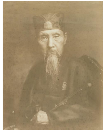
制作者不詳 《下岡蓮杖像》ゼラチン・シルバー・プリント 明治後期(c.1897-1912) 東京都写真美術館蔵

*2 上野彦馬(うえのひこま)…1838-1904年 写真師、蘭学者 長崎医学伝習所に入所し、化学を学ぶなかで写真術と出会い、写真技法の研究に着手する。日本初の写真技法書をふくむ『舎密局必携』を記したことも有名。