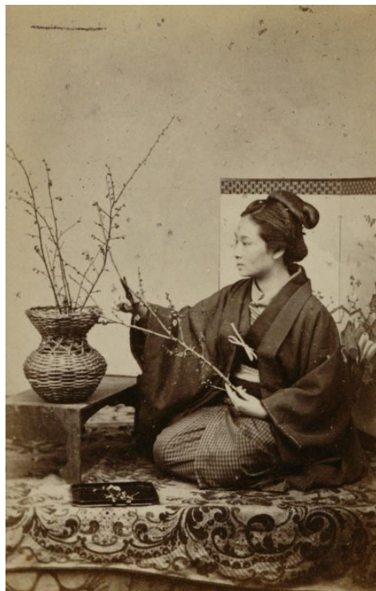
《梅の枝を活ける女性》鶏卵紙 文久三～明治九(1863-1876)年頃 東京都写真美術館蔵 ※後期のみ展示