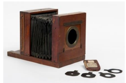
下岡蓮杖 写真器材 下田開国博物館蔵

蓮杖が写真師として過ごした時間以上に、その長寿な人生を画業に捧げたことはあまり知られていません。蓮杖は絵師としてキャリアをスタートさせ、20歳頃に江戸狩野派の画家・董川(とうせん)に師事し、その実力が認められ「董円(とうえん)」の号を与えられるまでに至ります。絵師としての生活のなかで写真と出会い、10年あまり研鑽を経て写真師となります。1876年頃、最愛の妻の死を境に拠点を東京・浅草に移し、写真とは異なる手業の画面制作へ情熱を傾けます。そこで写場背景画や、多くの日本画作品を制作しました。晩年の絵画作品には「写真元祖」の印章を用いており、写真と絵画の往来が蓮杖の礎となっていることがわかります。