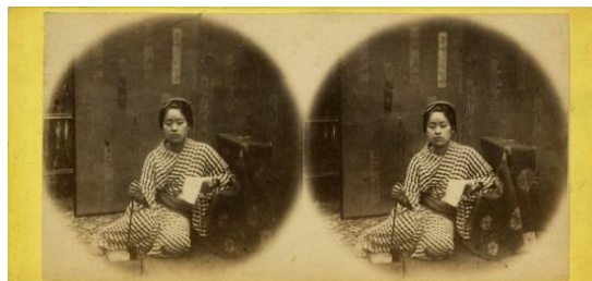
《煙管と煙草盆と少女》 G.A.B.「日本」ステレオ写真 鶏卵紙 慶応二～明治初(1866-1876)年頃 個人蔵 ※後期のみ展示

本展をより深く楽しむためのフロアレクチャーでは展覧会担当学芸員による通常の展示解説のほかに英語解説を実施。また、会期中には専門家によるトークセッションや鶏卵紙プリントワークショップなど初期写真への理解を深める多彩なプログラムを開催します。