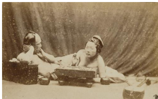
《間で囲碁を打つ男女》 鶏卵紙 文久三～明治九(1863-1876)年頃 ※前期のみ展示

写真師として名を馳せながら、生涯絵師として「和魂洋才」の信念を貫いた蓮杖。本展はその確かな実力を、精彩な日本画や工芸品など知られざる名品とともに紹介します。写真師・絵師、双方の仕事から才気溢れる表現者としての下岡蓮杖を浮き彫りにする展覧会です。