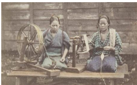
《糸つむぎ》 鶏卵紙に手彩色