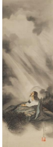
《ゲッセマネに祈るキリスト》 絹本着彩 明治三十二(1899)年 蓮杖写真記念館蔵

東京都写真美術館蔵の150点におよぶ名刺判写真(鶏卵紙・鶏卵紙に手彩色)、開業時期の制作と考えられる《木村政信像》(アンプロタイプ)をはじめ、《長谷部友二郎》(アンプロタイプ、長谷部安蔵)、『下岡蓮杖・白井秀三郎アルバム』(鶏卵紙・一般財団法人日本カメラ財団蔵)、《琴棋画図屏風》(紙本着彩・神奈川県立近代美術館)、《恵比寿図》(紙本墨画、下岡蓮杖記念館蔵)《達磨図》(紙本墨画、個人蔵)、《徳川家康像》(石版画、前田正隆氏寄贈・横浜開港資料館蔵)、《(達磨の火入れ)》(陶器、小川進コレクション)ほか、多彩な作品を展示します。