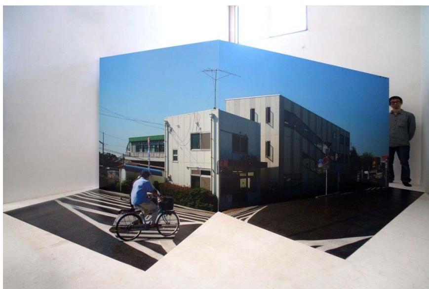
糸崎公朗+前衛実験 NETART <フォトモ> 六会日大駅前、2013 (参考図版)