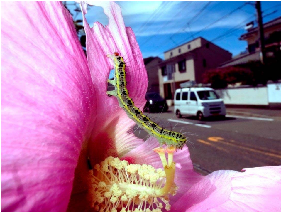
糸崎公朗 <路上ネイチャー> フタトガリコヤガ 藤沢市 2012年9月10日、2013

1965年長野県生まれ。80年代に隆盛した路上観察学の流れを汲み、「非人称芸術」という独自の概念を提唱。90年代より路上の物件写真を立体物に組み立てた「フォトモ」を手がける。以降、一貫して路上をフィールドとした作品シリーズを展開。第19回東川賞新人作家賞ほか。個展、グループ展、ワークショップ多数。