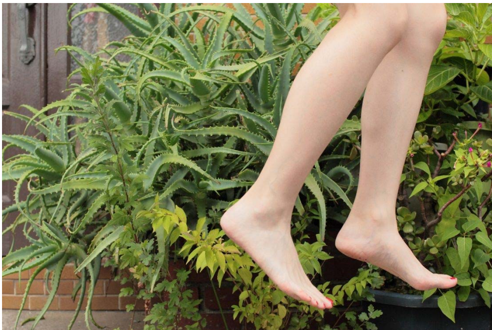
林ナツミ Today's Levitation 05/13/2011、2012