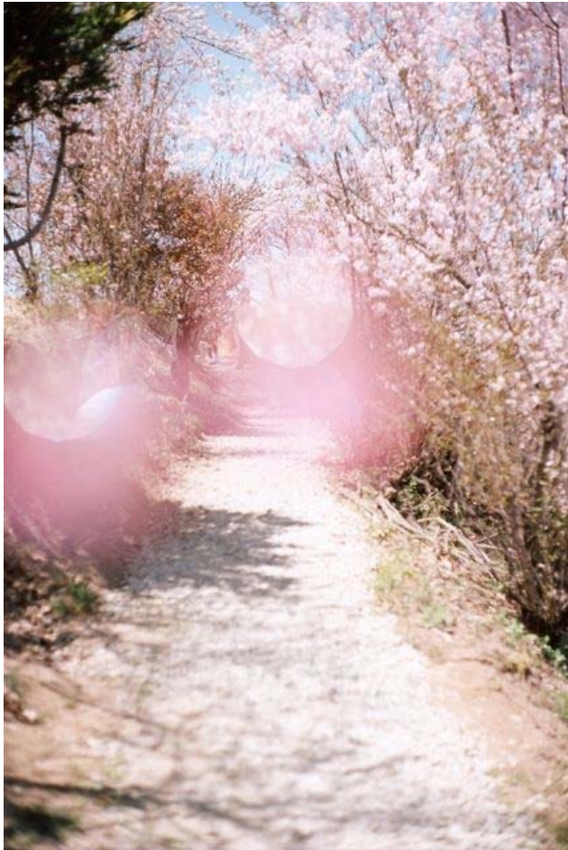
大森克己 〈すべては初めて起こる〉 福島市、福島、2011 東京都写真美術館蔵

1963 年兵庫県生まれ。94 年ロックバンド・マノネグラの 中南米ツアーに取材した《Good Trips, Bad Trips》で第 9 回写真新世紀優秀賞。以降、写真集での作品発表をはじめ、海外を含めた各地での個展多数。2011 年、桜に導かれた東京から福島への旅において撮影・制作された作品〈すべては初めて起こる〉を発表。