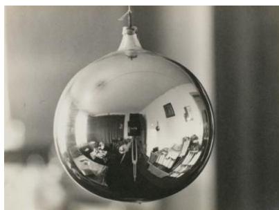
左) 鈴鹿芳康《#672 備頼(沖縄)》1993年 発色現像方式印画 右) 山脇巖《球体に反射する室内》1932年 ゼラチン・シルバー・プリント

水に映る光の像、ガラスや窓に映る世界。イメージは現と幻の境界にたどよい、どちらともつかない情趣や感覚、豊かな重なりあいを生み出す。