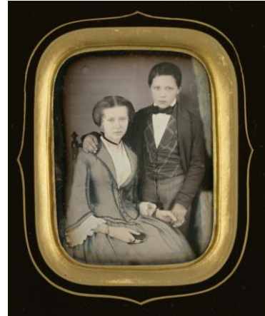
撮影者不詳《女性と少年像》 1840-1859 年 タゲレオタイプに手彩色

主催 東京都 東京都写真美術館 協賛 凸版印刷株式会社 会場 東京都写真美術館 3 階展示室