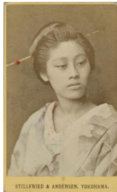
左) マン・レイ《理性への回帰》1923年 ゼラチン・シルバー・プリント 右) スティルフリード&アンデルセン社《題不詳(芸者像)》明治初期 鶏卵紙に手彩色

物質の質感、皮膚感。ものの表面とディテールへのフェティッシュな感覚。そしてモノクロームの印画紙の表層に色彩をのせる「化粧」をほどこすことで、外国人を魅了したエキゾチックな明治期の横浜写真。