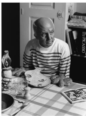
左) ロベール・ドアノー《ピカソの心》1952年 ゼラチン・シルバー・プリント 右) 森村泰昌《なにものかへのレクイエム (創造の劇場/ナプロ・ピカソとしての私)》2010年 ゼラチン・シルバー・プリント

ひとつのイメージは他のイメージを源泉として未来に再生される。ひとつのイメージは過去の視覚文化の歴史とつながっている。