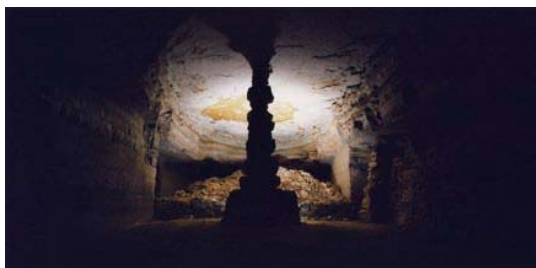
畠山直哉 《Ciel Tombé #5602》 2007年 発色現像方式印画