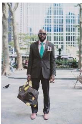
ザ・サートリアリスト 《ニューヨーク》 2007年9月 インクジェット・プリント