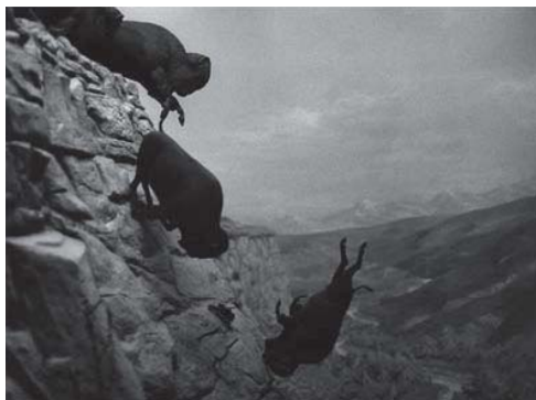
デヴィッド・ヴォイナロヴィッチ 《無題（転げ落ちるバッファロー）》 1988-89年 ゼラチン・シルバー・プリント