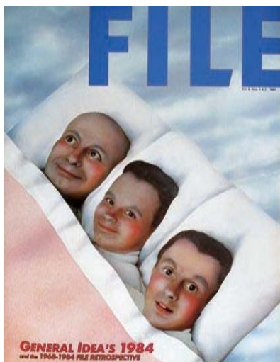
ジェネラル・アイデア 《File Magazine (vol. 6, no. 1&2)》 1984年 冊子