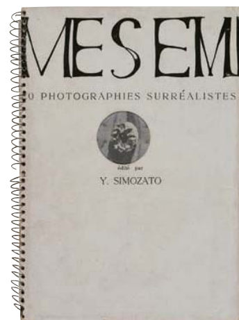
下郷羊雄、田島二男、坂田稔、佐藤泰平、稲垣泰三、佐野秀雄 《超現実 主義写真集 メセム属》 1940年 写真網目版印刷