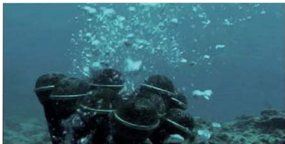
山城知佳子 《沈む声、紅い息》 2010年 シングルチャンネル・ビデオ