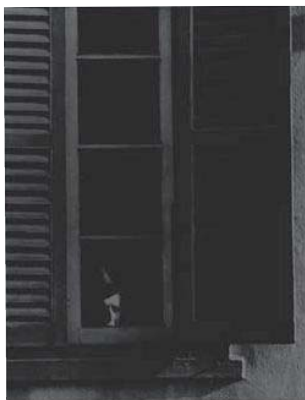
安井仲治 《流氓ユダヤ 窓》 1941年 ゼラチン・シルバー・プリント