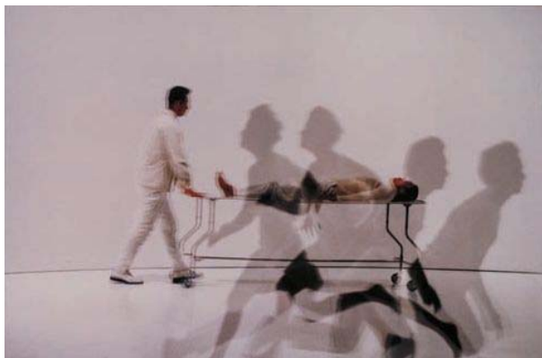
ダムタイプ 《OR》 1998年／初演：1997年 シングルチャンネル・ビデオ