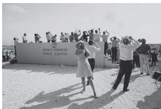
ゲイリー・ウィングランド 《アポロ11号、月ロケットの打ち上げ、ケネディ宇宙センター、フロリダ》 1969年 ゼラチン・シルバー・プリント