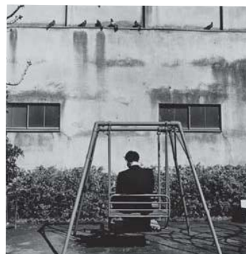
須田一政 「東京景」より 1975-78年 ゼラチン・シルバー・プリント