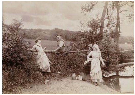
ウィリアム=ヘンリー=ピーチ・ロビンソン 《He Never Told His Love》 1884年 鶏卵紙