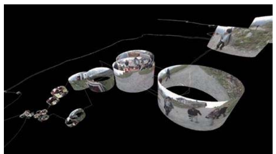
藤幡正樹 《故郷とは？ジュネーブにて／Landing Home in Geneva》 2005年 インタラクティブ・ビデオ・インスタレーション