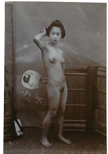
作家不詳 《題不詳（ヌード）》 明治時代中期 ゼラチン・シルバー・プリント