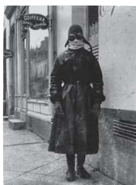
ジャック・アンリ・ラルティエグ 《パリからルザへの道で》 1919年 ゼラチン・シルバー・プリント