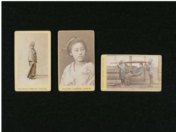
スティルフリード&アンデルセン 《明治風俗写真（名刺判）》 1877-1883年頃 鶏卵紙