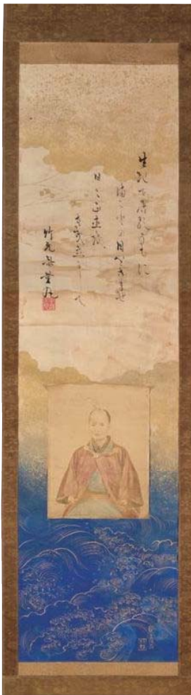
竹元斎量丸 《導歌》 明治時代中期 鶏卵紙に手彩色