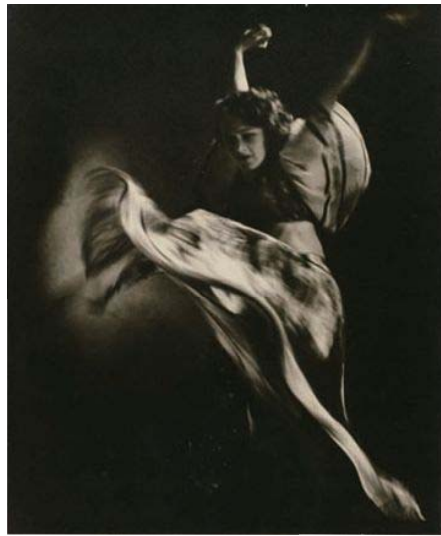
紅谷吉之助 《無題》 1934年 ゼラチン・シルバー・プリント