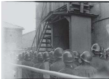
北井一夫 「抵抗」より 1965年 ゼラチン・シルバー・プリント