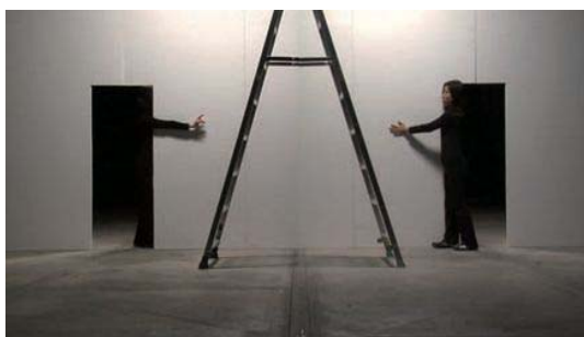
越田乃梨子 《破れのなかのできごと〜壁〜》 2008年 シングルチャンネル・ビデオ