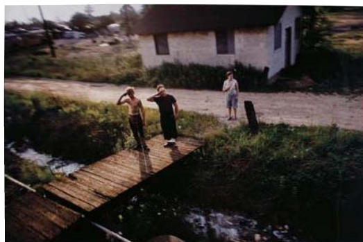
ポール・フスコ 《ロバート・F.ケネディの葬式列車》 1968年 銀色素漂白方式印画