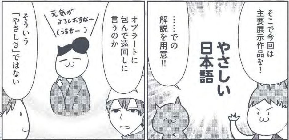
※外国人にもわかるよう配慮して簡単にした日本語