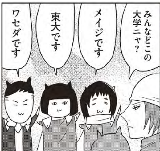
ほかにワカスギ(工学院大)、ヤマダ(日大)、メイフェイス(東大)も在籍