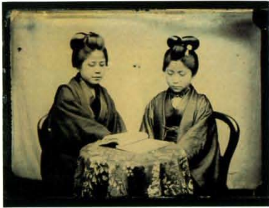
作家不詳「読書する二人の少女」1870年代 アンプロタイプ

日本に写真術が渡来したのは、今から約140年前、江戸時代末のことでした。西欧文明の利器として、蘭学者たちを中心に研究が行われ、写真の歴史の幕開けがなされました。幕末には、横浜と長崎に写真館が開業し、明治に入ると日本全国へと広がってゆきます。写真の浸透は、西洋的な視覚をもたらしただけでなく、明治のニューメディアとして社会に大きな変容をもたらしました。