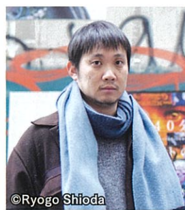
濱口竜介 Ryusuke Hamaguchi

1978年生まれ。2015年に317分の長編映画『ハッピーアワー』が多くの国際映画祭で主要賞を受賞。2018年、商業映画デビューとなる『寝ても覚めても』がカンヌ国際映画祭コンペティションに選出され、世界各国、30以上の地域で劇場公開された。