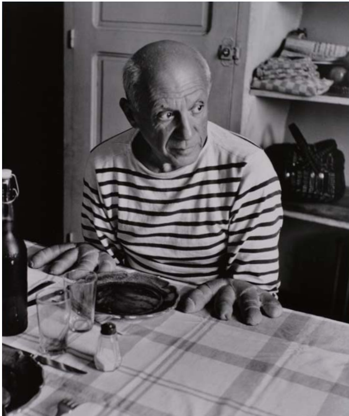
ロベール・ドアンノー《ピカソのパン》1952年 セラチン・シルバー・プリント