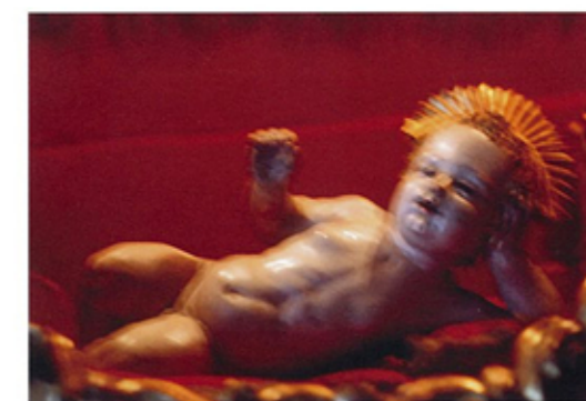
シリーズ(陽と骨)より