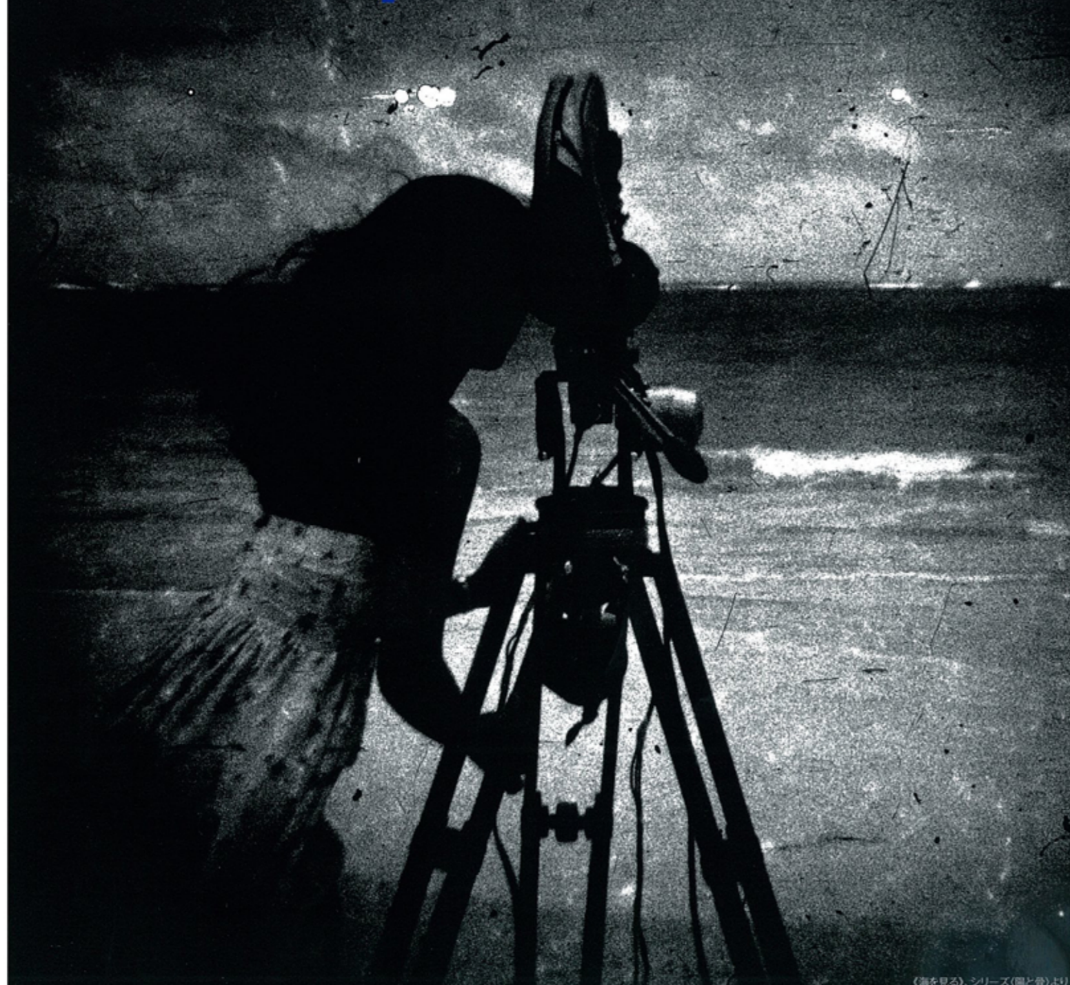
《海を見る》、シリーズ(陽と骨)より