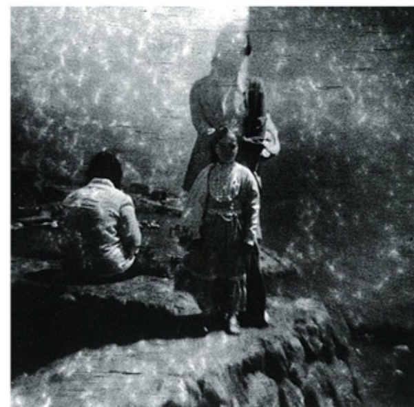
《明日を見る家族》、シリーズ(陽と骨)より