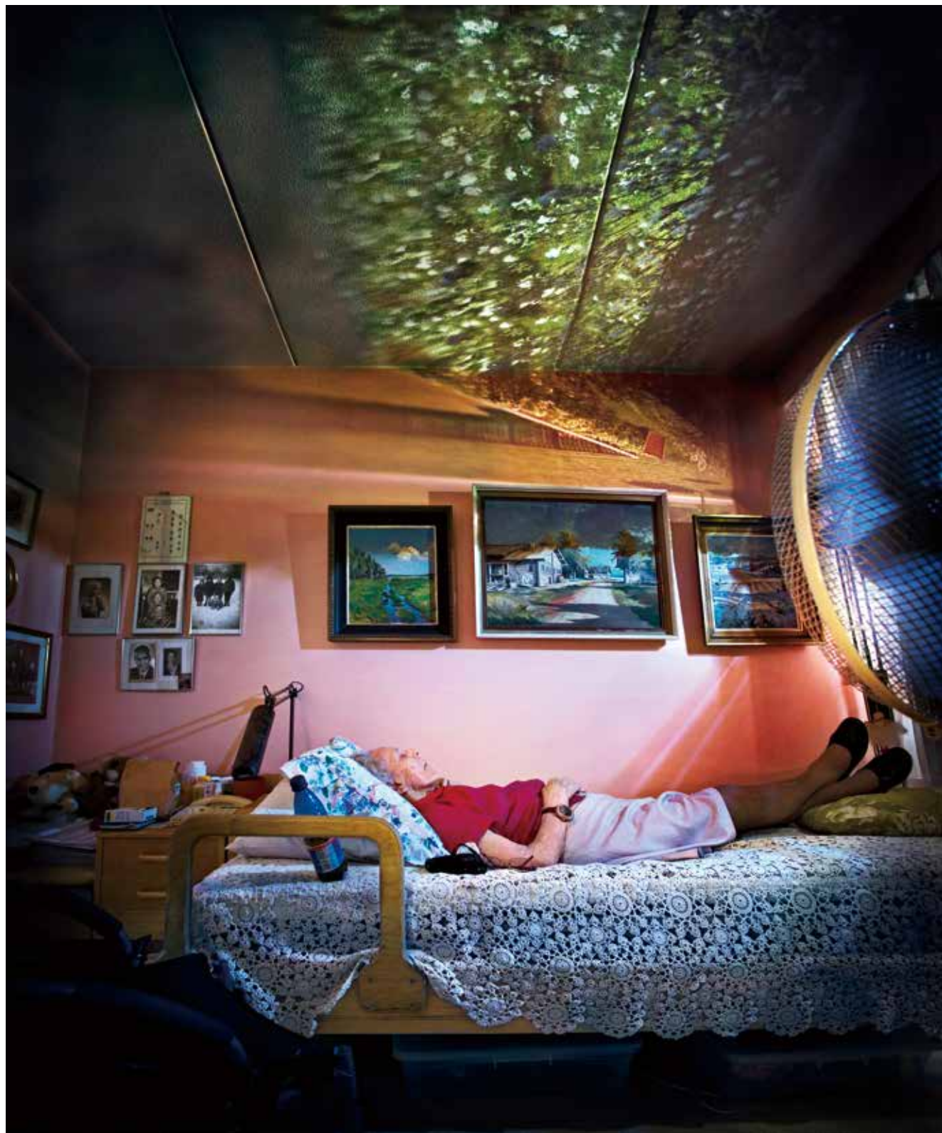
マルヤ・ピリラ《カメラ・オブスクラ/ルース》〈インナー・ランドスケープス、トゥルク〉より 2011年 作家蔵