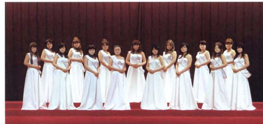
澤田知子 (TIARA) 2007年、インクジェット・プリント、作家蔵