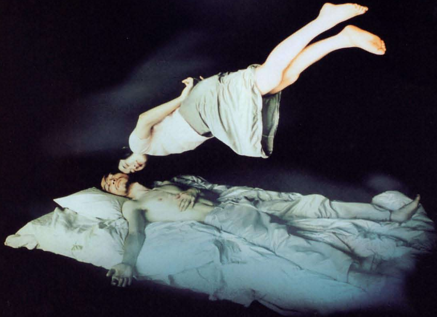
志賀理江子 (千愛子) [CANARY] より、2007年、発色現像方式印刷、作家蔵

Tokyo Metropolitan Museum of Photography October 18 - December 7, 2008