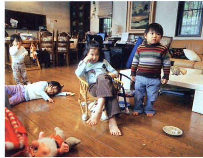
朝海陽子 (ホームアローン, Tokyo) [Sight] より、2007年、発色現像方式印刷、作家蔵

Asahi アサヒビル芸術文化財団 | Shorcal | TOPPAN | FUJIFILM | Canon | Asahi | Photographers' Laboratory | COLOR SCIENCE LABO