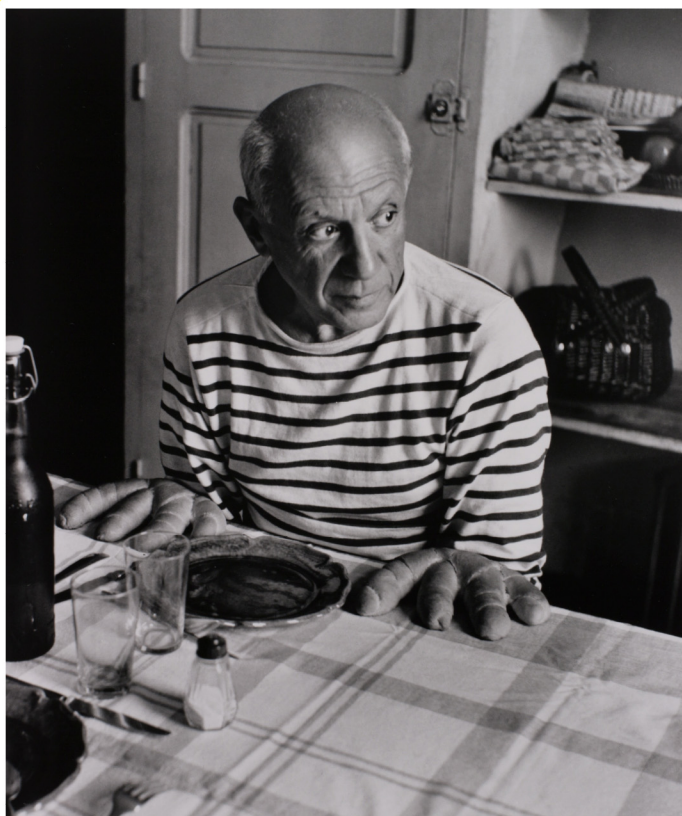
ロベール・ドアノー《ピカソのパン》1952年 セラチン・シルバー・プリント