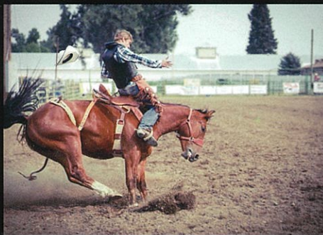
写真作品部門【文部科学大臣賞】 影田 篤俊