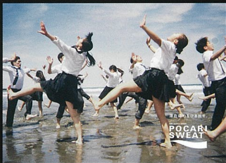
広告作品部門【優秀賞】 奥山 由之

【主催】公益社団法人日本広告写真家協会(APA) 【共催】東京都写真美術館 【後援】経済産業省/文化庁/東京都 【協賛】エプソン販売(株)/オリンパス(株)/キヤノンマーケティングジャパン(株)/(株)玄光社/(株)資生堂/ソニーイメージングプロダクツ&ソリューションズ(株)/(株)ニコンイメージングジャパン/(株)ビクトリコ/富士フイルムイメージングシステムズ(株)/(株)フレームマン/(株)堀内カラー(五十音順) 【協力】法人賛助会員各社