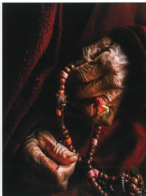
第42回2017JPS展 文部科学大臣賞 増田俊次「帰依」3枚組