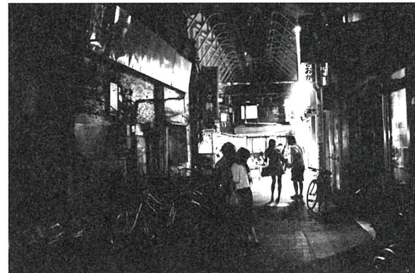
中藤毅彦 〈STREET RAMBLER〉より 2015