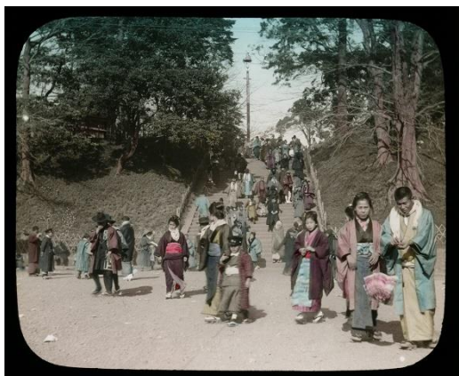
高木庭次郎〈日本風景風俗100選〉より 1910-23年 ガラス・スライドに手彩色