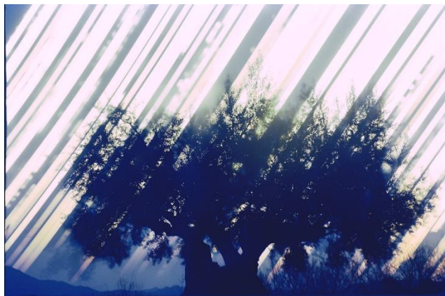
05_02 北野謙〈光を集める〉より《香川県土庄町 小豆島 千年樹 2017年冬至-2018年夏至》2017-18年 インクジェット・プリント 作家蔵