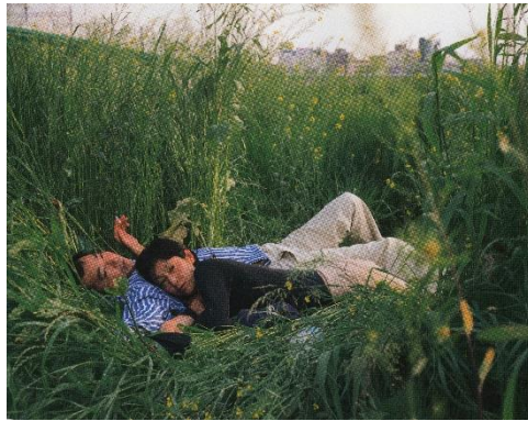
2点とも 《Picnic》より 1995-2003年 作家蔵