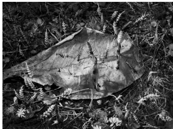
左：《伊達市国見町》右：《会津若松市》 〈Fukushima〉より 2013年 東京都写真美術館蔵