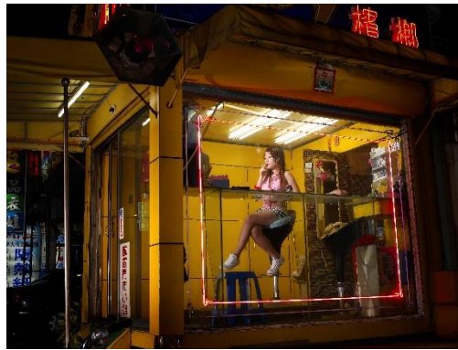
2点とも〈Binran〉より 2004-2007年