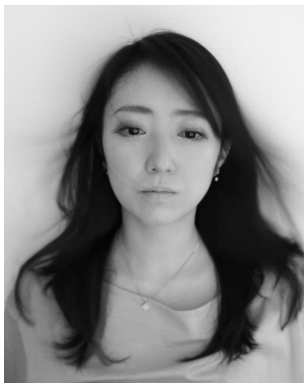
2点とも 〈Silent Mode 2020〉より 2019-2020年 作家蔵