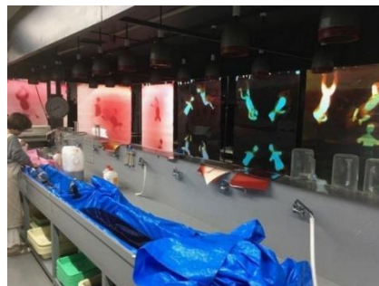
制作風景（参考図版）

暗室で柔らかい場所に敷いた印画紙の上へ赤ちゃんにのってもらい、ストロボを発光させて輪郭を写し取るフォトグラムという手法で作品を共同制作します。