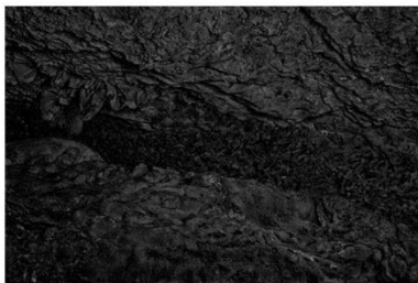
《#036》〈ガマ：闇〉より 2015年 インクジェット・プリント

それからリチャード・セラをリサーチしたんですけど、すごくいいことを言っている。「ドローイングはいつもペインティングの下に隠れてる。僕はその隠れたドローイングを見せたい」。この言葉もヒントになりました。