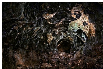
オサム・ジェームス・中川 《#009》〈ガマ〉 より 2010年 インクジェット・プリント 東京都写真美術館蔵

[演奏者紹介] フェデリコ・アゴスティーニ（ヴァイオリニスト、元イ・ムジチ合奏団コンサート・マスター）