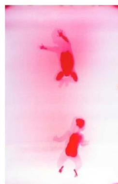
《P8》〈未来の他者〉より 2018年 発色現像方式印画 (フォトグラム)

真っ暗な中で、赤ちゃんを印画紙の上にのせてもらったのですが、親御さんが手を離れた瞬間に「ぎゃーっ」と大泣き。阿鼻叫喚でした(笑)。パシャってストロボを焚いて、抱き上げてください、と。