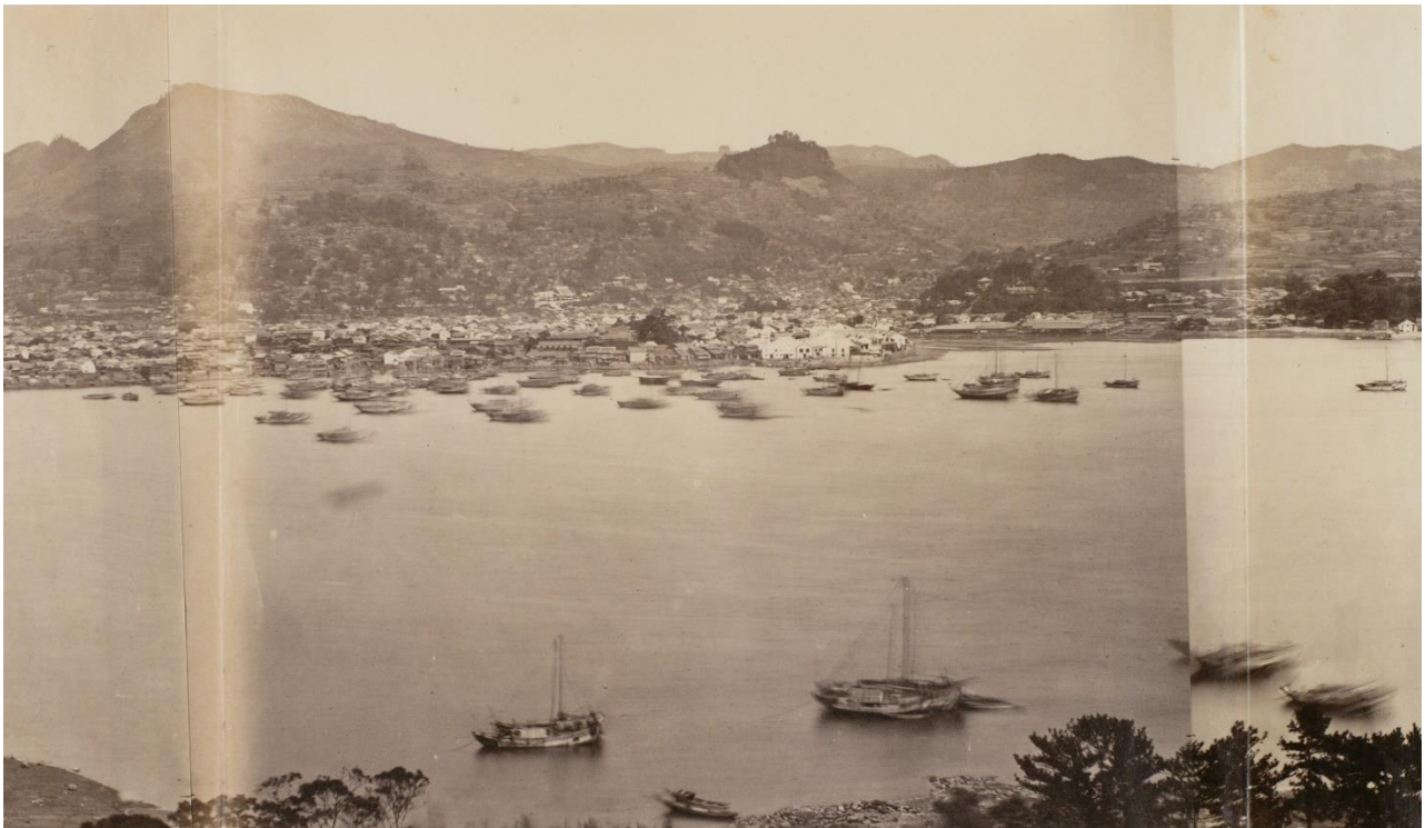
プロイセン東アジア遠征団写真班 《(長崎パノラマ)》(部分) 1861年 東京都写真美術館

2018年3月6日(火) — 5月6日(日) [4月9日(月)に展示替えを行います]