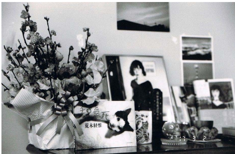
すべて 〈写狂老人 A 日記 2017.1.1-2017.1.27-2017.3.2〉 2017年より