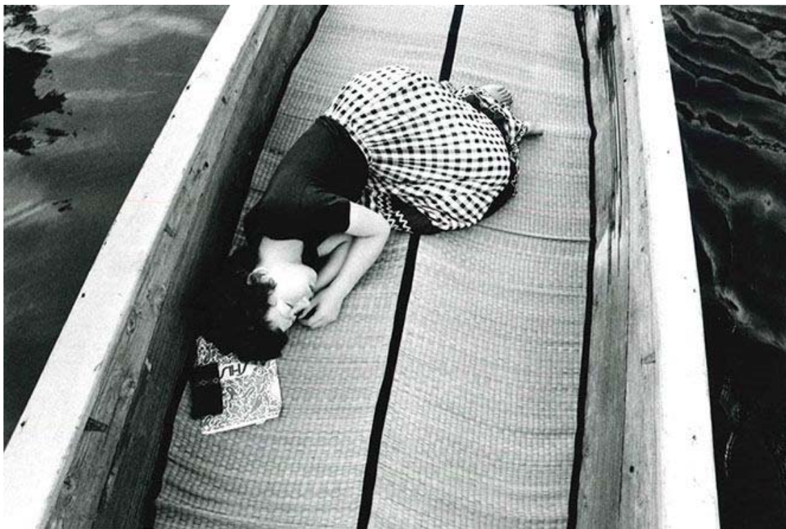
〈センチメンタルな旅〉 1971年より