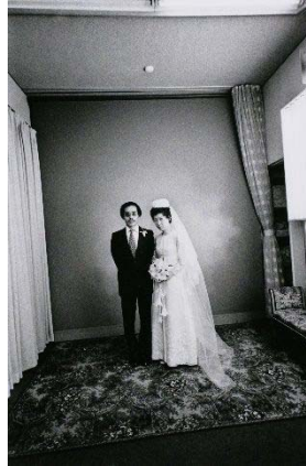
〈センチメンタルな旅〉 1971年 より 東京都写真美術館蔵