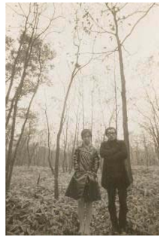
〈愛のプロローグ ぼくの陽子〉 1960年代末-1970年代初頭 より