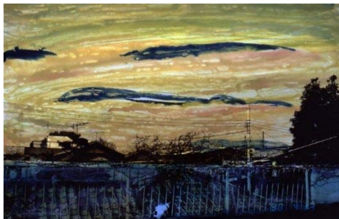
左 〈空景〉 1989-1990年より