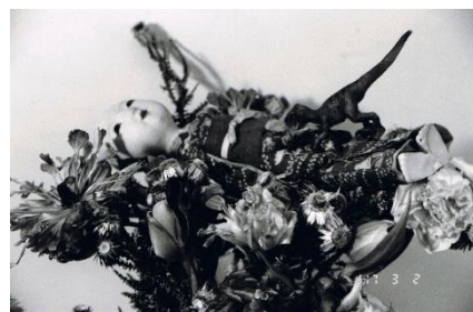
すべて 〈写狂老人 A 日記 2017.1.1-2017.1.27-2017.3.2〉 2017 年 より