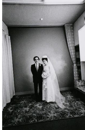
〈センチメンタルな旅〉 1971年 より 東京都写真美術館蔵