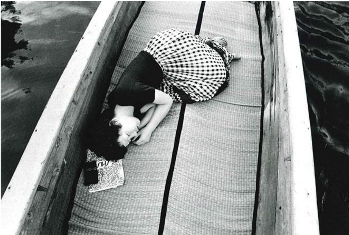
〈センチメンタルな旅〉 1971年より