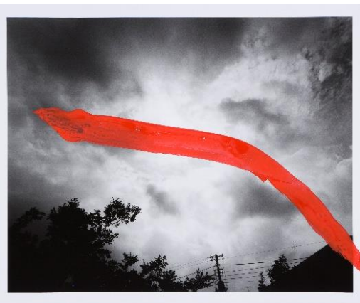
上下とも〈遺作 空2〉2009年より