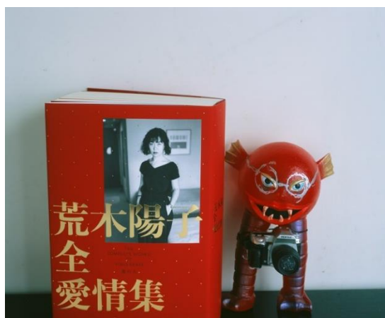
荒木陽子全愛情集 2017 年