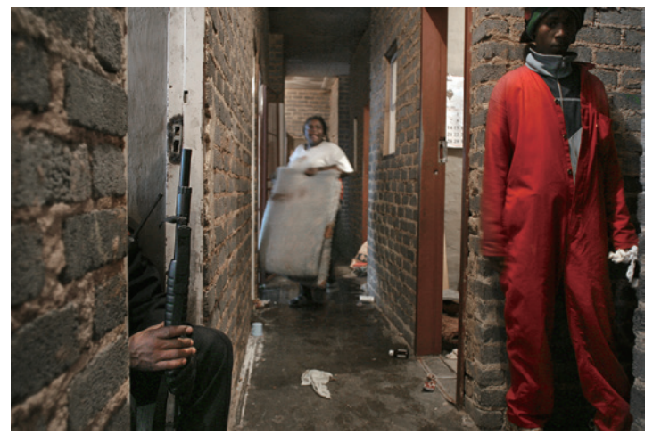
Eviction by the Red Ants, Auret Street, Jeppestown