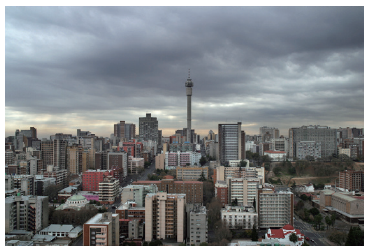
View of Hillbrow looking north from the roof of the Mariston Hotel