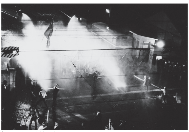
「10.21 とはなにか」を出版する会 防衛庁、「10.21 とはなにか」より 1968 年 10 月 21 日 個人蔵