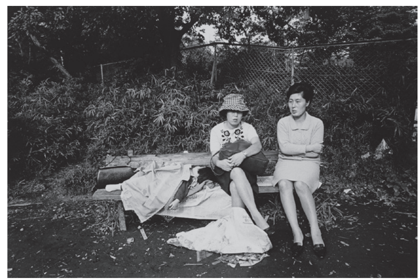
牛腸茂雄 「日々」より 1967-70 年 東京都写真美術館蔵