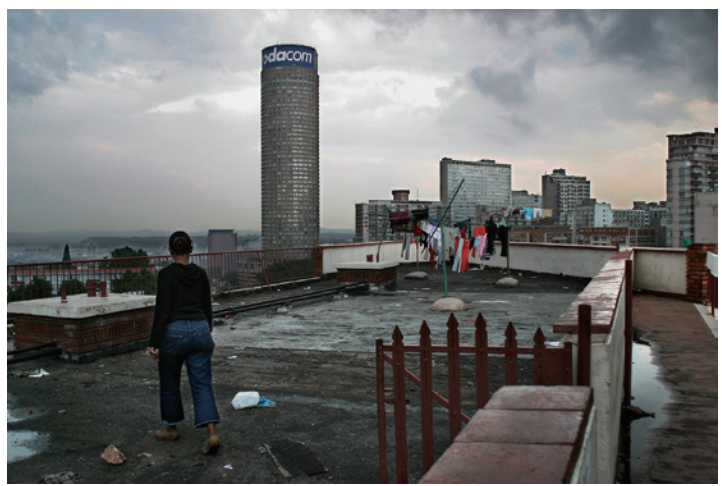
Al's Tower, a block of flats on Harrow Road, Berea, overlooking the Ponte building