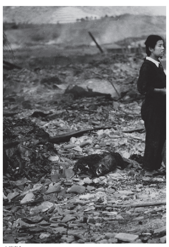
山端庸介 焼死体のわきに、茫然と立ちつくす若い女性(浜口町付近、南 500m) 1945 年 8 月 10 日午後 1 時過ぎ 東京都写真美術館蔵