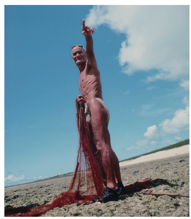
東松照明 開いた海一奄美、「われらをめぐる海」より 1966 年 東京都写真美術館蔵