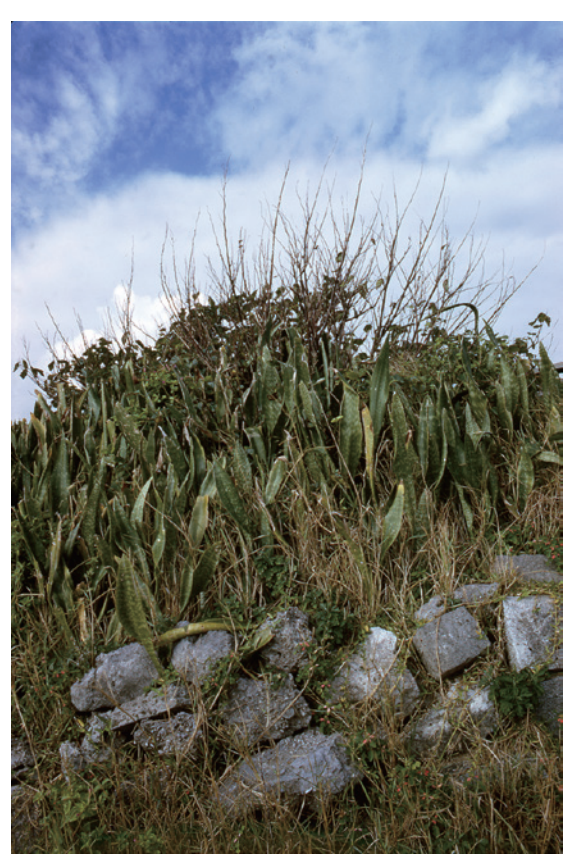
中平卓馬《奄美》 1975 年 個人蔵