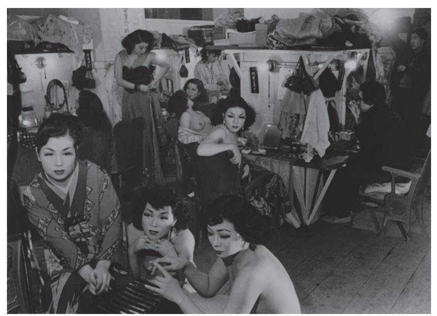
大東元《カジノ座の人々》1953 年 東京都写真美術館蔵