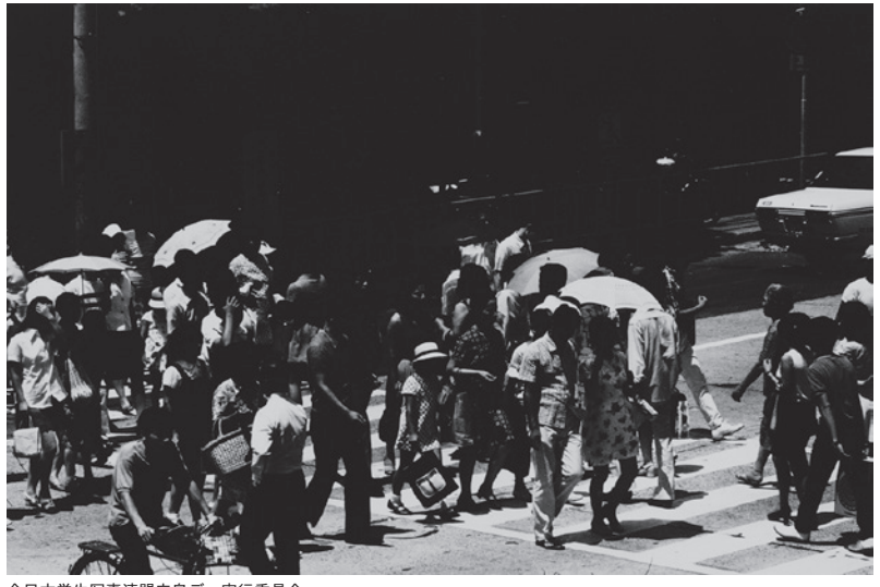
全日本学生写真連盟広島デー実行委員会 「ヒロシマ・広島・hírou-ʃímə」より 1968-71 年 個人蔵