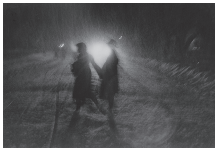
大東元《雪の幻想》1953 年 東京都写真美術館蔵