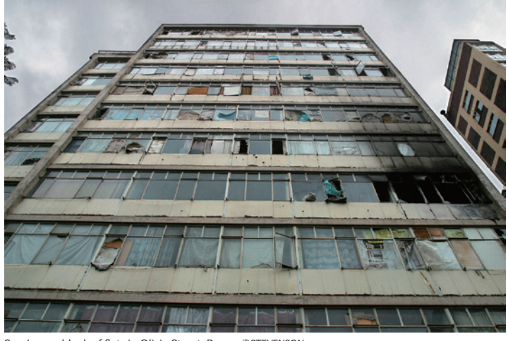
San Jose, a block of flats in Olivia Street, Berea