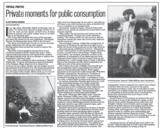
The Asahi Shimbun, March 17, 2006 6)