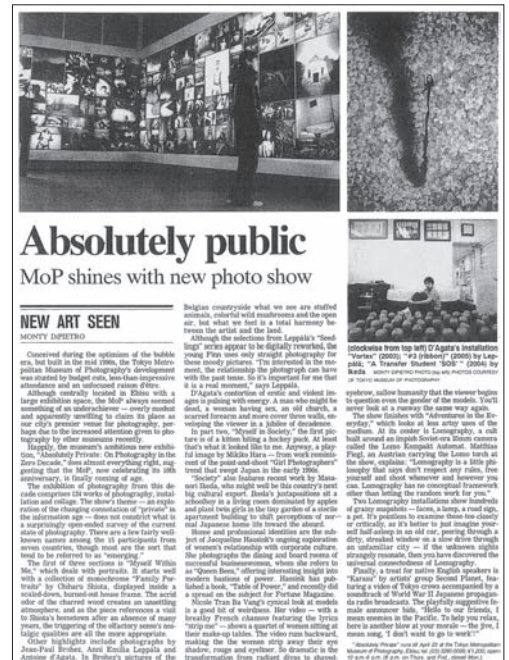
The Japan Times, March 15, 2006 5)