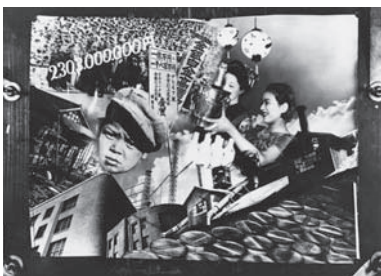
図版8 大久保好六《非常時風景》1933年