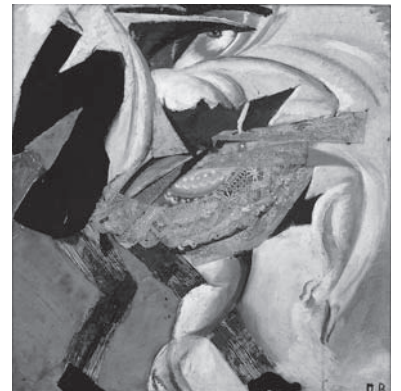
図版5 ヴィクトル・パリモフ《踊る女》 1920年（東京都現代美術館蔵）