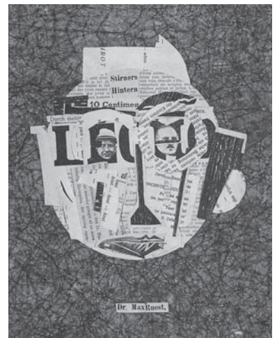
図版1 ラウル・ハウスマン 《マックス・ルエスト博士》1919年 （大阪市立近代美術館建設準備室蔵）

しかしダダイズムの作品に関して言えば、新聞記事を組み合わせたラウル・ハウスマン《マックス・ルエスト博士》（1919年）（図版1）のことをフォトモンタージュと称し、一方ではマン・レイの《アングルのバイオリン》（1924年）（図版2）をコラージュと呼ぶのが通例である。しかしこの二つとも上記の区別から考えれば逆の技法にあたる