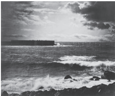
図版3 ギュスターヴ・ル・グレイ 《海景》1856-58年

より理想のイメージに近づけるために行われたこの行為は、ダダやシュルレアリスムのように、行為に意味を持たせるものではなかった。