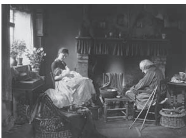
図版4 ヘンリー・ピーチ・ロビンソン 《夜明けと日没》1862年