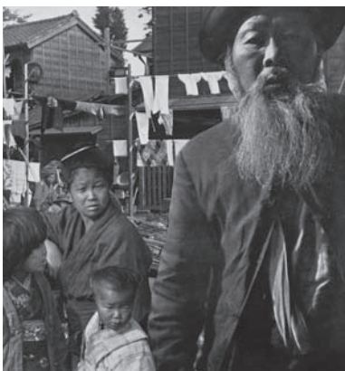
図版9 飯田幸次郎《無題(下町の人々)》1933年(『光画』より)

写真における一つのジャンルとして、フォトモンタージュという形式があることは誰でも知っている。