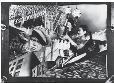
図版8 大久保好六《非常時風景》1933年