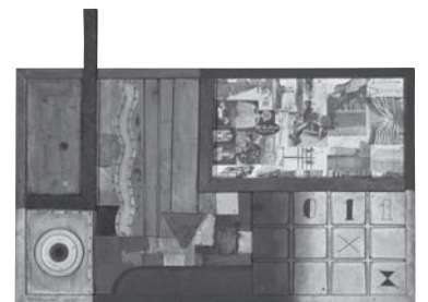
図版6 村山知義《コンストラクチオン》 1925年（東京国立近代美術館蔵）