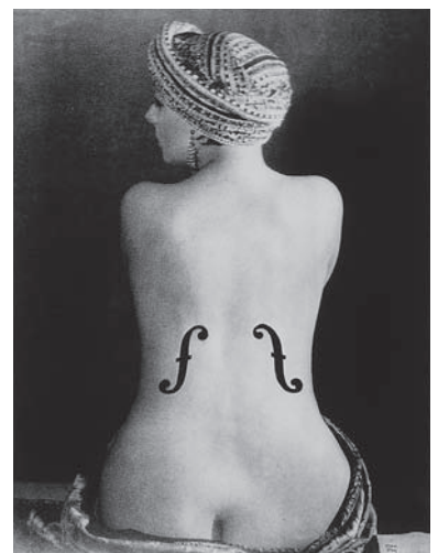
図版2 マン・レイ《アングルのバイオリン》 1924年