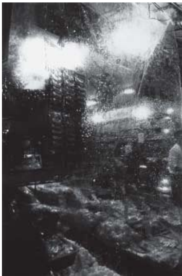
中平卓馬 《無題》 1968-69年 ゼラチン・シルバー・プリント