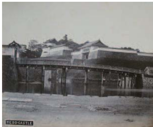
STILLFRIED, Baron Raimund von 《シュティルフリートが明治4,5年頃撮った風景写真》より 《YEDO-CASTLE》 1871-1872 鶏卵紙