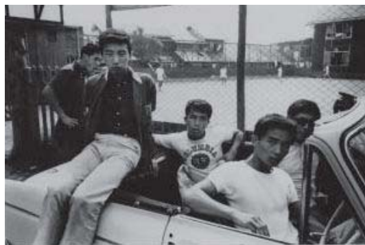
新倉孝雄 《セーフティ・ゾーン》より《旧軽井沢》 1964年 ゼラチン・シルバー・プリント