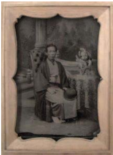
江崎禮二 《松村由章像》 1886年 アンプロタイプ