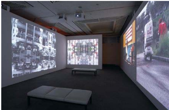
古郷卓司《NON_SITES》2009年 マルチ・デジタル・プロジェクション