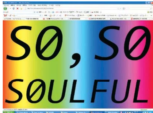
チャン・ヨンヘ重工業《SO, SO SOULFUL》2009年 フラッシュ・アニメーション