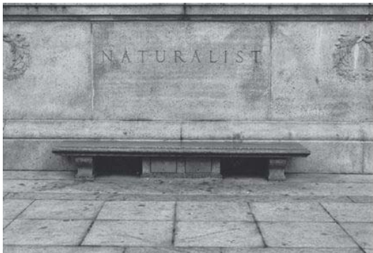
フェリックス・ゴンザレス＝トレス《untitled (Natural History)》1990年 ゼラチン・シルバー・プリント ©1991 The Felix Gonzalez-Torres Foundation