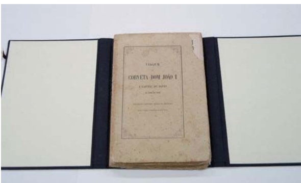
ペレイラ提督『日本使節記』1863年