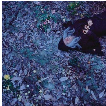
やなぎみわ「My Grandmothers」《MITUE》2009年 発色現像方式印画