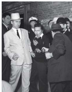
森村泰昌《なにものかへのレクイエム (OSWALD 1960.11.24-2006.4.1)》2006年 ゼラチン・シルバー・プリント