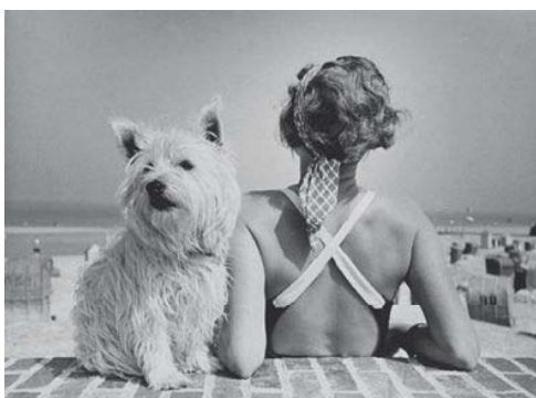
パウル・ヴォルフ《題不詳（犬と女性）》1925～1933年 ゼラチン・シルバー・プリント