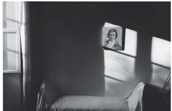
エルベ・ギベール《Villa Medicea》1989年 ゼラチン・シルバー・プリント