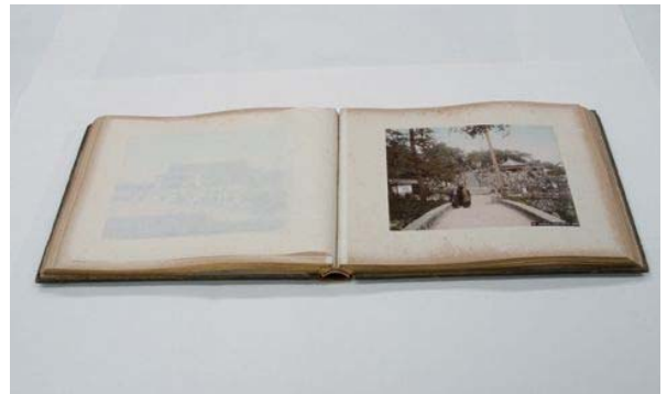
日下部金兵衛『時絵アルバム』鶏卵紙に手彩色