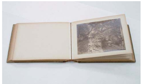
制作者不詳『明治古写真時絵アルバム』鶏卵紙