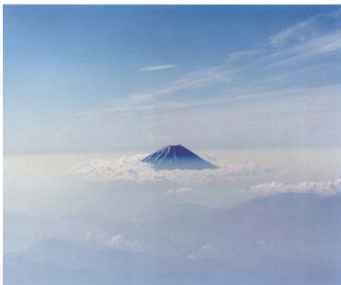
石川直樹「Mt.fuji」より2008年 発色現像方式印画