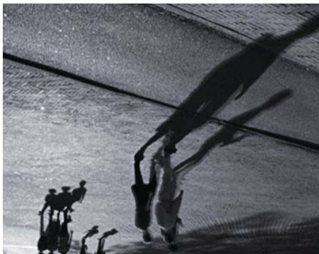
フィオナ・タン《ダウンサイド・アップ》2002年 シングル・チャンネル・ビデオ・インスタレーション