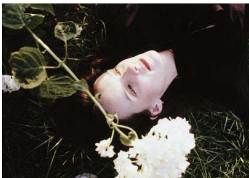
古屋誠一《Wien, 1983》1983年 発色現像方式印画