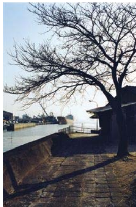
尾仲浩二《山口県岩国 2009.2》2009年 発色現像方式印画