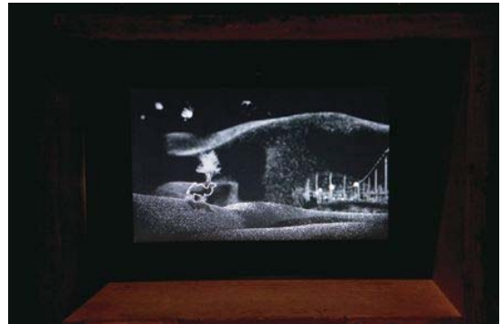
さわひらき《HIDDEN TREE》2007年 シングルチャンネル・ステレオサウンド・ビデオインスタレーション