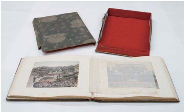
玉村写真館『明治写真時絵アルバム』鶏卵紙に手彩色