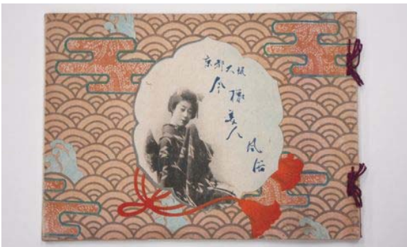
小川一真『京都大阪今様美人風俗』1898年 コロタイプ印刷