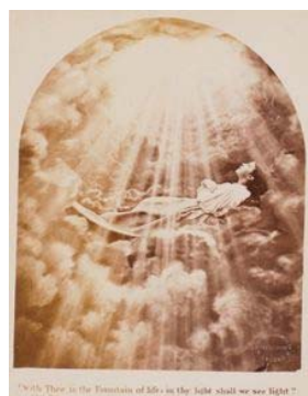
C. テュネ《With Thee in the Fountain of Life》1865年頃 鶏卵紙