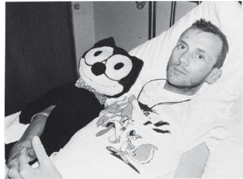
ウィリアム・ヤン《アラン》2010年 ゼラチン・シルバー・プリント