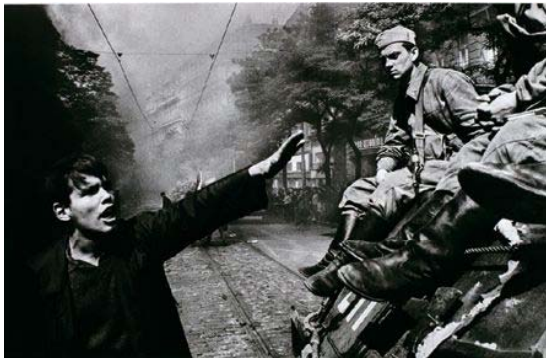
ヨセフ・クーデルカ「Invasion 68」より《ブラハ》1968年8月 インクジェット・プリント