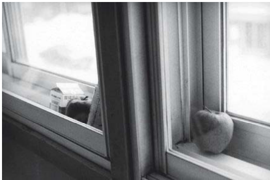
操上和美「NORTHERN」より1993年 ゼラチン・シルバー・プリント