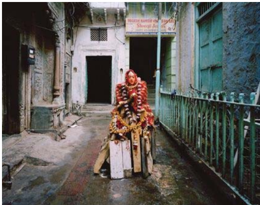
百瀬俊哉《デリー》2006年 発色現像方式印画