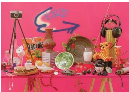
オノデラユキ《12speed》2008年 インクジェット・プリント