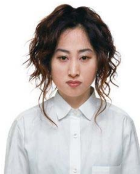
北島敬三《PORTRAIS/A-1》2009年 発色現像方式印画