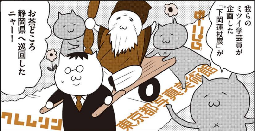
※「没後百年 日本写真の開拓者 下岡蓮杖」2014年3月4日~5月6日@写真