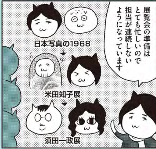
※須田展では6月着任の新人イトウくんも副担②で活躍します